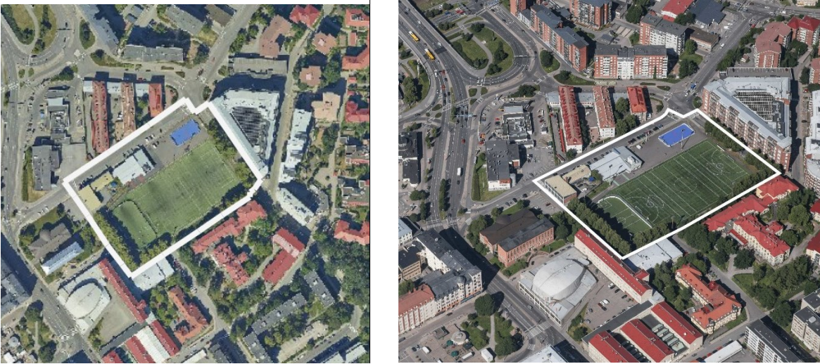
Kuva: Ilmakuva ja viistoilmakuva suunnittelualueesta

Suunnittelualan lähiympäristössä on useita kaupunkikuvassa merkittäviä rakennettuja ympäristöjä kuten Konserttitalon, Ammatti-instituutin ja Maakunta-arkiston muodostama kokonaisuus, Parkinmäen palvelutalojen kokonaisuus sekä Verkatehtaan rakennus. Alue sijaitsee linja-autoaseman ja Aninkaistenkadun vilkkaan joukkoliikenneväylän lähellä.