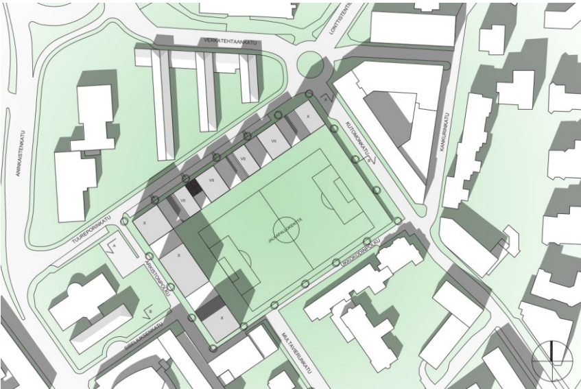
Kuva: Kansallis-kehitys Oy:n alustavia suunnitelmia alueen rakentamisesta, 14.6.2017, arkkitehtitoimisto K2S.