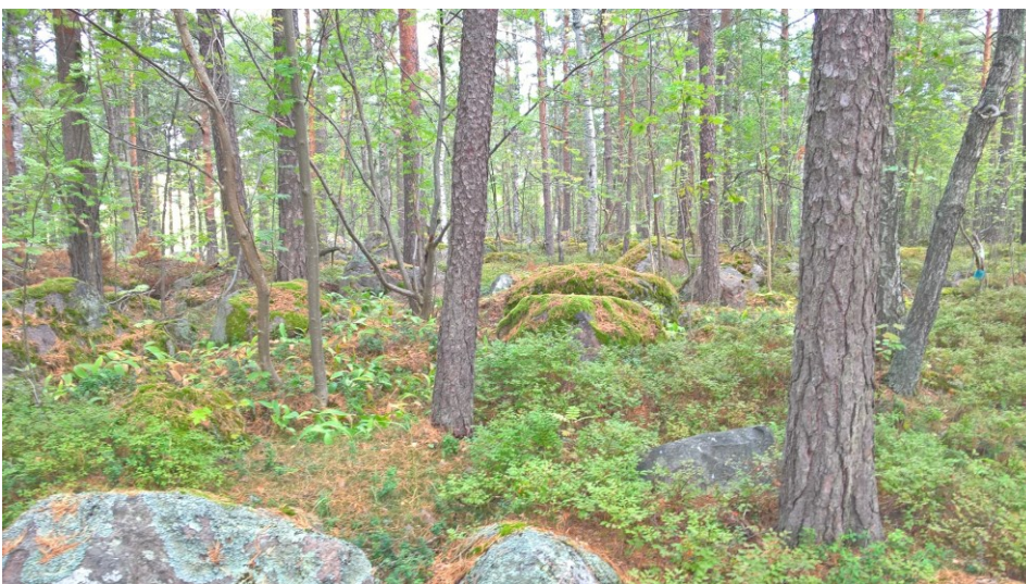
Yksi kaava-alueen maisemallisesti huomioitavia muinaisrantoja

Luontoselvitys alueelta on tehty v. 2009 - 2010, ja sitä on päivitetty 2018. Luontoselvityksen mukaan Retrodormin ympäristön rinteiltä löytyy mm. merkittäviä muinaisrantoja, joissa on satoja siirtolohkareita ja komeita mäntyjä. Muinaisrannat siirtolohkareineen suositellaan säästettäväksi, ja vanha maisemallisesti edustava puusto otettavaksi huomioon alueen maankäytössä ja viheralueiden käsittelyssä. Varsinaisia uhanalaisia kasvilajeja tai luontotyyppisiä alueella ei ole.