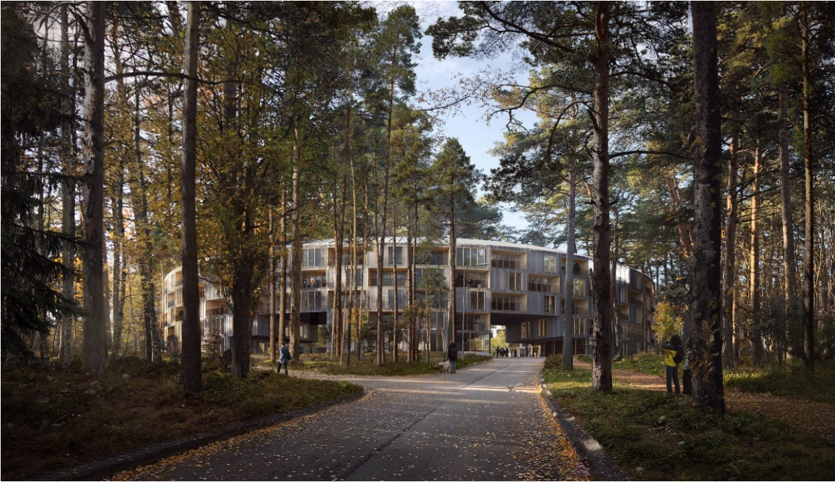
Reale Oy ja Schauman & Nordgren Architects. Kilpailun 2.vaiheen voittajaehdotus.