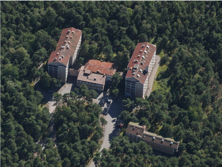
Ilmakuva nykyisestä Retrodormista, entisestä Luolavuoren vanhainkodista

Kaavoitustyön aikana on tehty Luolavuoren vanhainkodin rakennushistoriallinen selvitys. Muita selvityksiä laaditaan kaavoitustyön niin vaatiessa.