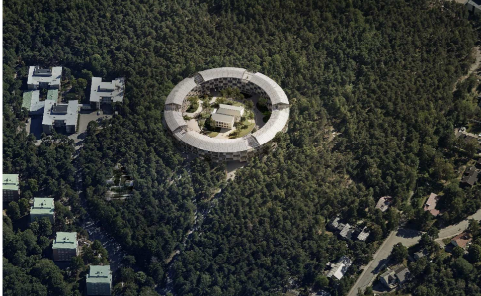
HAVAINNEKUVA Viitesuunnitelma 30.3.2021