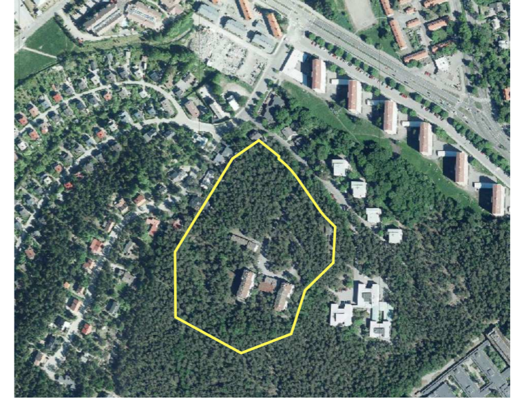
HAVAINNEKUVA Viitesuunnitelma 30.3.2021