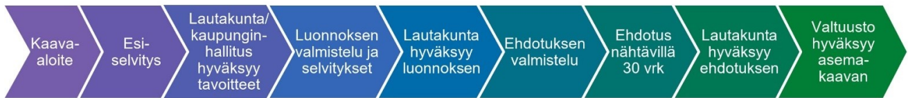
XL-kokoisen kaavan prosessi

Osallisia kaavan valmistelussa ovat alueen maanomistajat ja ne, joiden asumiseen, työntekoon ja muihin oloihin kaava saattaa huomattavasti vaikuttaa, sekä viranomaiset ja yhteisöt, joiden toimialaa suunnittelussa käsitellään. Tämän hankkeen osalta osallisiksi on arvioitu seuraavat tahot: