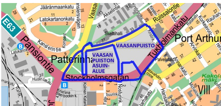
Kuva 2. Vaasanpuiston asuinalueen ja Vaasanpuiston kaavarajaukset.

Kaavamuutosalue oli alun perin osa Vaasanpuiston kaavamuutosaluetta, joka jaettiin helmikuussa 2025 kahteen osaan. Toisen osan työnimenä säilyi Vaasanpuisto. Jako on esitetty kuvassa 2. Jakamisella varmistetaan, että Linnakaupungin monitoimitalon edellyttämä kaavamuutos valmistuu rakennuksen toteutuksen vaatimassa aikataulussa.