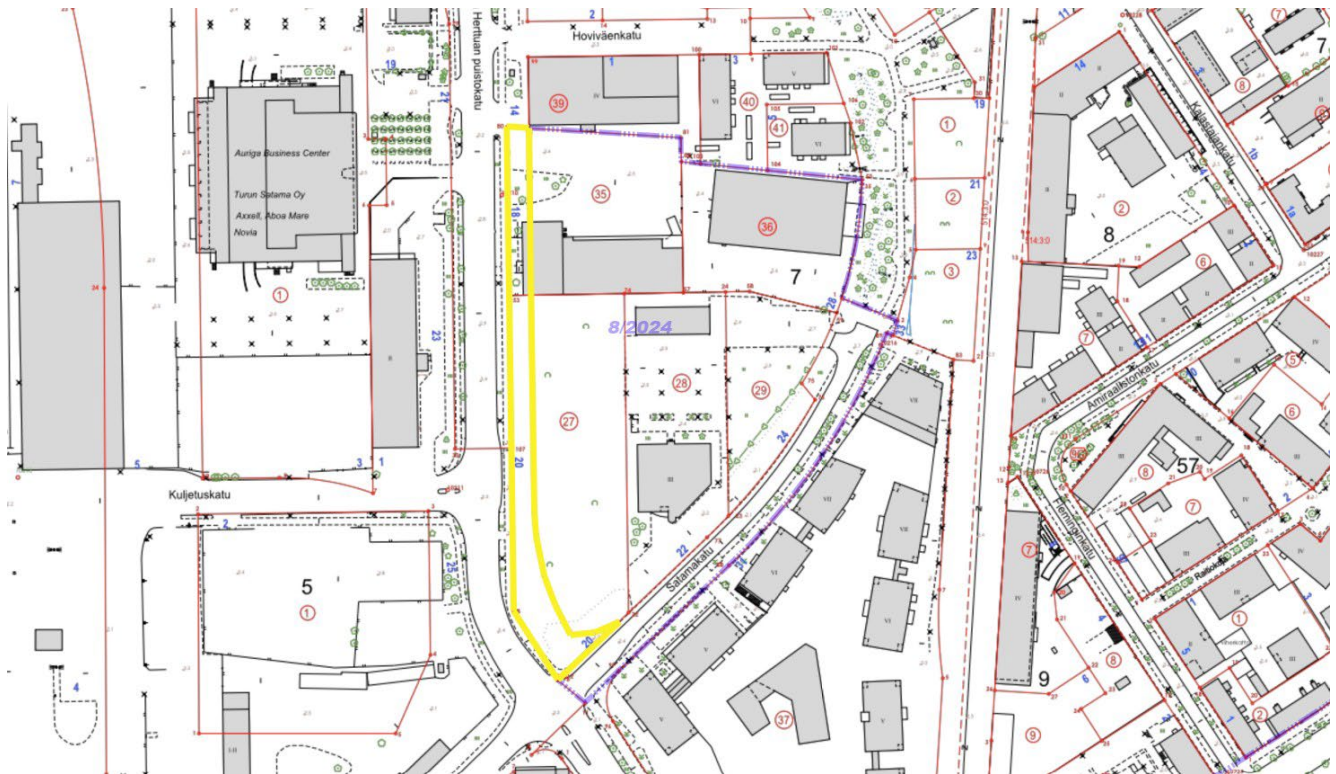
Kuva 2. Kantakartassa näkyy vireillä oleva kaavamuutos "Tullin ympäristö" (kaavatunnus 8/2024) ja keltaisella kaavarajaus kaavamuutokseen "Juhana Herttuan puistokatu 18 ja 20".

Tontti 27 (kiinteistötunnus 853-61-7-27) on rakentamaton, yksityisen toimijan omistama tontti, johon kehitetään asumista Tullin ympäristön kaavamuutoksella. Suunnitelmissa on varauduttu katualueen leventämiseen. Tontti 35 (kiinteistötunnus 853-61-7-35) on kaupungin omistuksessa, mutta on vuokrattu yksityiselle toimijalle pitkällä vuokrasopimuksella. Tontilla sijaitsee yksityisen toimijan omistama toimisto- ja tuotantorakennus, joka on huomioitu säilytettäväksi raitiotien katusuunnitelmissa.