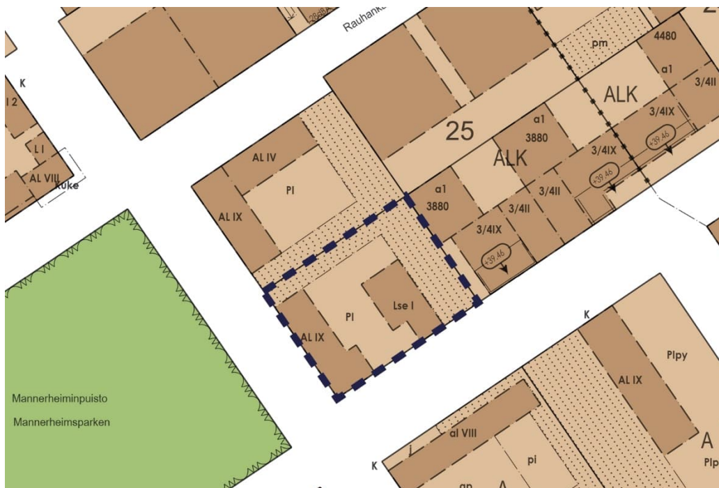
Kuva 6. Ote ajantasa-asemakaavasta ja kaavarajaus katkoviivalla.

Lisäksi asemakaavassa on osoitettu Rakentamatta jätettävä pihamaana käytettävä tontinosa (PI, kuva 6) ja Rakentamatta jätettävä istutettava tontinosa (pisterasteri, kuva 6). Istutettavaa aluetta koskee käyttötapamääräys: Maistraatin hyväksymän suunnitelman mukaan istutettava ja puistomaisessa kunnossa pidettävä puutarhamaa.