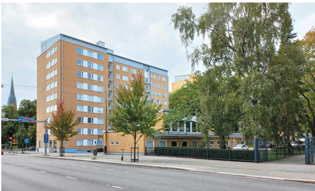
Kuva 3. Suunnittelualue valokuvassa Puutarhakadun suunnasta.