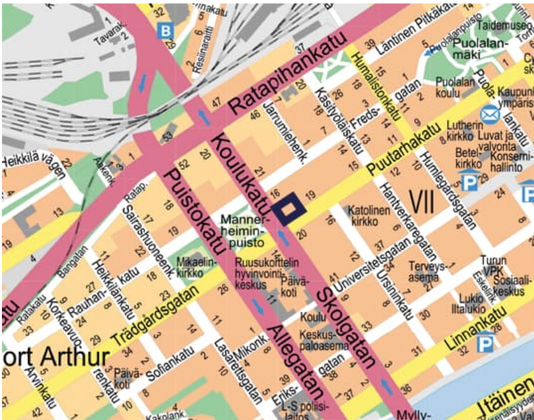
Kuva 1. Kaava-alueen sijainti.