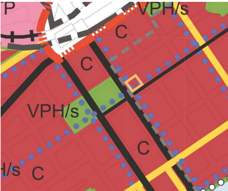
Kuva 4. Yleiskaava 2029: Kartta 1 (Yhdyskuntarakenne) ja kaavarajaus oranssilla.

Suunnittelualue sijaitsee alueella, jolla on 1800-luvun kaavoihin pohjautuvia palokujannepuita (vaalea rengasrasteri, kuva 5). Rakentaminen tulee pyrkiä sijoittamaan siten, että vanha palokujannepuusto säilyy. Mikäli puita joudutaan kaatamaan, tilalle tulee istuttaa uudet.