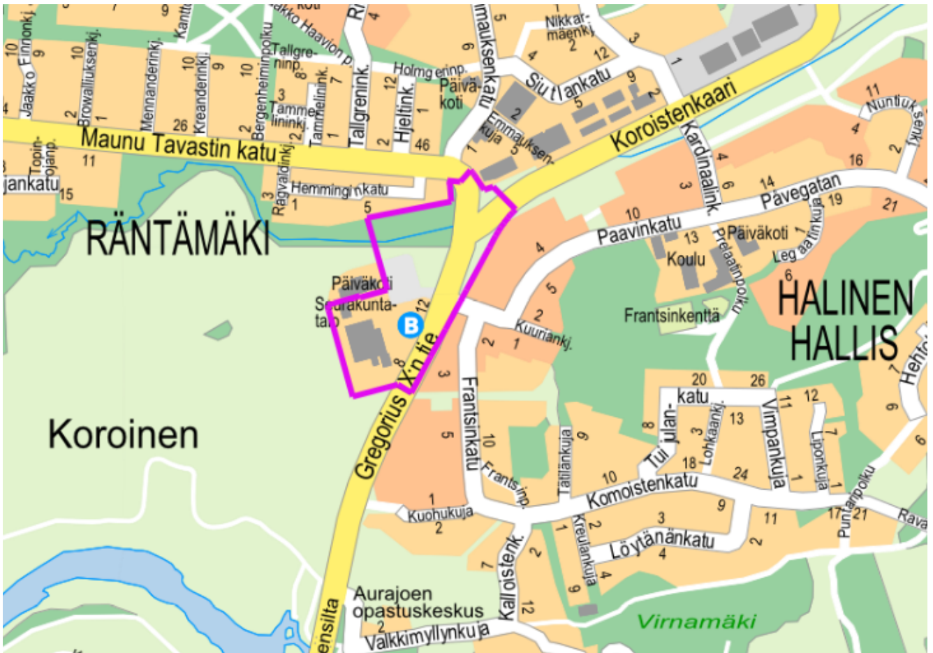
Kuva 1. Kaava-alueen sijainti.

Kaupunginosat: Halinen, Röntämäki Osoite: Gregorius IX:n tie