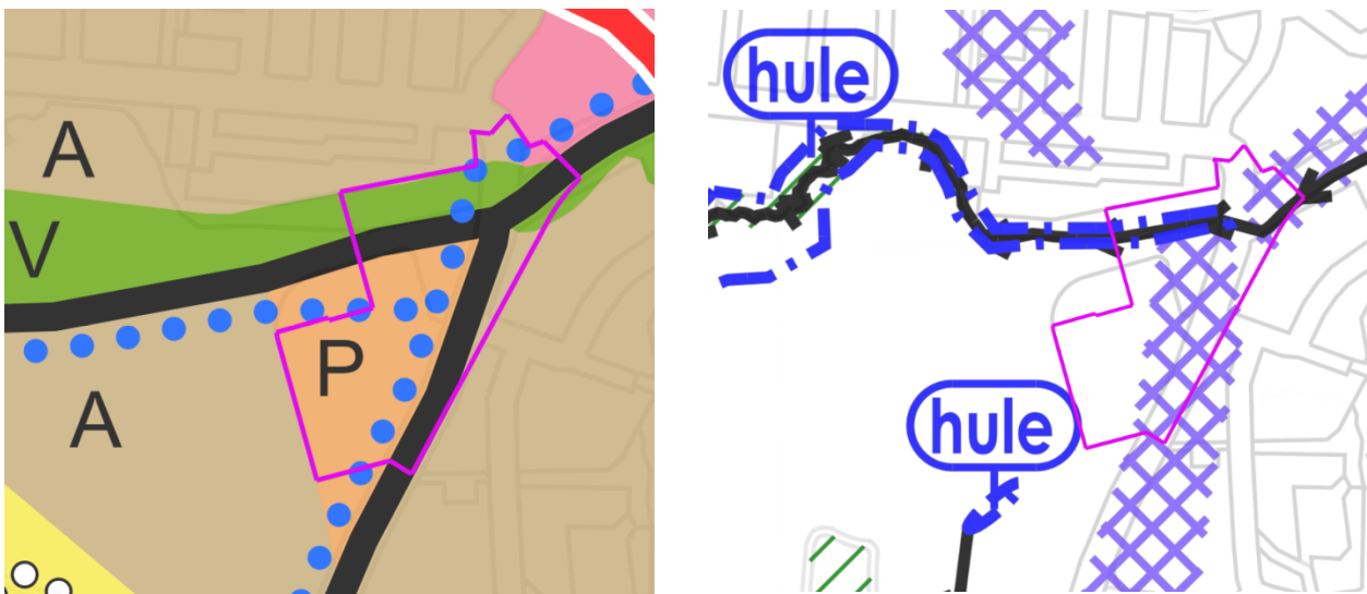
Kuvat 2 ja 3. Otteet Yleiskaava 2029:n Yhdyskuntarakenne- ja Kestävä vesien hallinta-teemakartoista.

Turun yleiskaava 2029 on tullut voimaan 10.8.2024. Yleiskaavassa suurin osa suunnittelualueesta on osoitettu palvelujen, hallinnon ja kaupan alueeksi (P). Vähäisessä määrin alueita on osoitettu myös mm. virkistykseen (V) ja kaupunkiseudun pääväyläksi (paksu musta viiva). Pyöräilyn pääverkostolle on osoitettu reitti P-alueen läpi (sininen palloviiva).