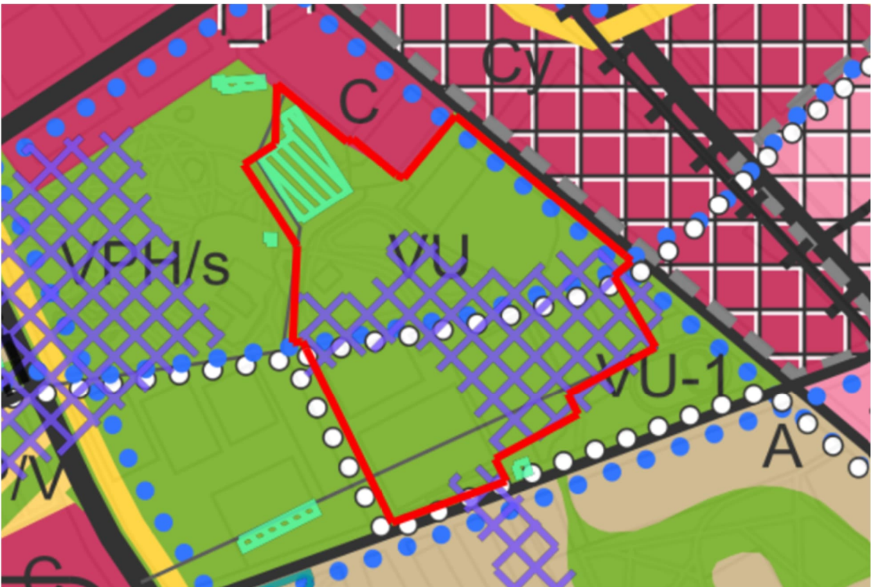
Kuva 2. Ote Yleiskaava 2029:n kartoista 1 Yhdyskuntarakenne, 5 Kestävä vesien hallinta ja 8 Arvokkaan rakennetun ympäristön kohteet. © Turun kaupunki

Kupittaaapuisto ja Kupittaaan urheiluhalli ovat osa 3.8.2002 voimaan tullutta asemakaavaa Kupittaaapuisto (30/1999). Ajantasa-asemakaavassa Kupittaaapuisto on virkistysaluetta (V) sekä urheilu- ja virkistyspalvelujen aluetta, jossa sallitaan urheilu- ja virkistystoimintaa palvelevien rakennusten ja katso-motilojen rakentaminen erikseen osoitetuille rakennusaloille (VU-1). Muilta osin Kupittaaapuisto on osoitettu urheilu- ja virkistyspalvelujen alueeksi (VU). Hippoksentien varrella sijaitsevat pysäköintialue on osoitettu puistoksi (VP). Kupittaaan urheiluhallin tontti on osa urheilutoimintaa palvelevien rakennusten korttelialuetta (YU) ja urheiluhalli on suojeltu merkinnällä sr-2. Suojelumääräyksen mukaan kaupunkikuvallisesti ja rakennustaiteellisesti arvokasta rakennusta ei saa purkaa ilman pakottavaa syytä eikä siinä saa suorittaa vaipan ulkopuolella sellaisia lisärakentamis- tai muutostöitä, jotka tarvelevät julkisivujen ja vesikaton perusmuotoa. Kaavarajaus ulottuu lisäksi Kupittaaapuistoon VP-1/s -osoitetulle puistoalueelle, jossa sallitaan virkistystoimintaa ja uimalaa palvelevien huolto-, kahvila- ja ravintolarakennusten rakentaminen erikseen osoitetuille rakennusaloille.