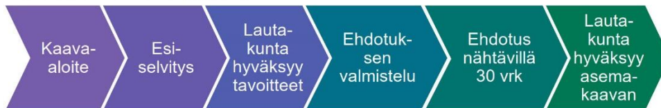
M-kokoisen kaavan prosessi

Osallisia kaavan valmistelussa ovat alueen maanomistajat ja ne, joiden asumiseen, työntekoon ja muihin oloihin kaava saattaa huomattavasti vaikuttaa, sekä viranomaiset ja yhteisöt, joiden toimialaa suunnittelussa käsitellään. Tämän hankkeen osalta osallisiksi on arvioitu seuraavat tahot: