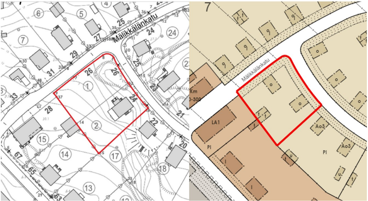
Kuva 2. Kaava-alue kantakartalla (vas.) ja ajantasaisessa asemakaavassa (oik.) © Turun kaupunki