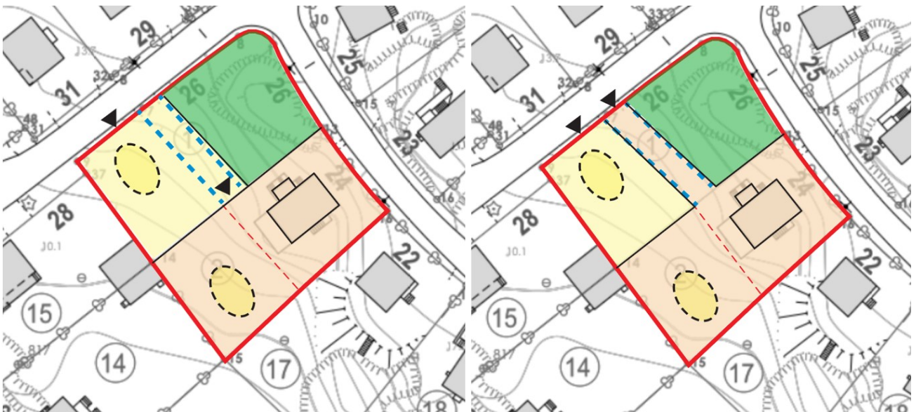
Kuva 3. Kuvassa kaavioita aloitteen pohjalta piirretyistä maankäytön muutoksen mahdollisuuksista. Sinisen katkoviivan kohdalla kulkee tontin 2 nykyinen ajotie sekä vesijohdot. Katkoviivan pyöreillä alueilla on esitetty paikat tontin 1 rakennusalan siirrolle ja tontin 2 uudelle (max 100 k-m 2 ) rakennusalalle.

Kaikki tämän kirjeen saajat ovat kyseisessä kaavahankkeessa osallisia. Osallisia ovat kaikki ne, joiden asumiseen, työntekoon tai muihin oloihin kaava saattaa huomattavasti vaikuttaa, sekä ne viranomaiset ja yhteisöt, joiden toimialaa suunnittelussa käsitellään. Osallisilla on mahdollisuus osallistua kaavan valmisteluun, arvioida kaavoituksen vaikutuksia ja lausua kirjallisesti tai suullisesti mielipiteensä asiasta.