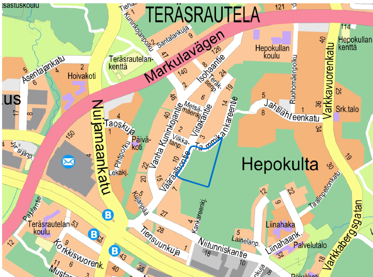
Kuva 1. Kaava-alueen sijainti.

Kaupunginosa: Teräsrautela 076 Osoite: Tammikankareentie