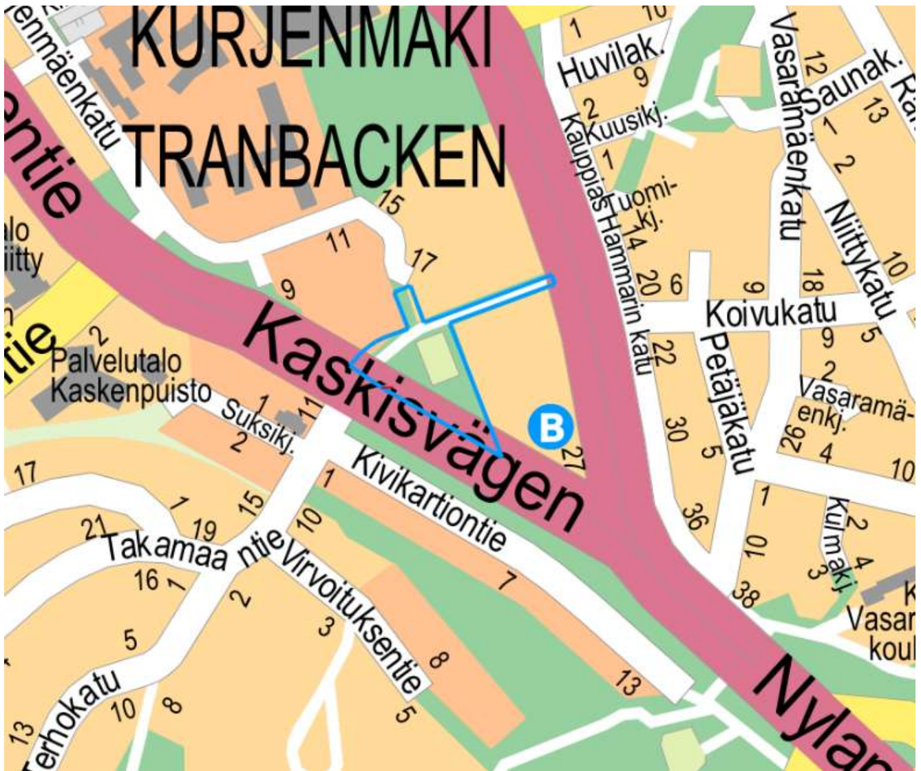
Kuva 1. Kaava-alueen sijainti. © Turun kaupunki