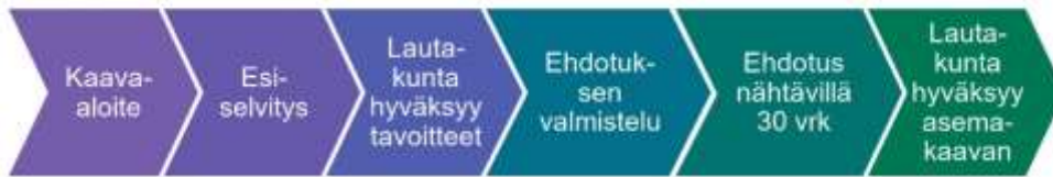
M-kokoisen kaavan prosessi

Osallisia kaavan valmistelussa ovat alueen maanomistajat ja ne, joiden asumiseen, työntekoon ja muihin oloihin kaava saattaa huomattavasti vaikuttaa, sekä viranomaiset ja yhteisöt, joiden toimialaa suunnittelussa käsitellään. Tämän hankkeen osalta osallisiksi on arvioitu seuraavat tahot: