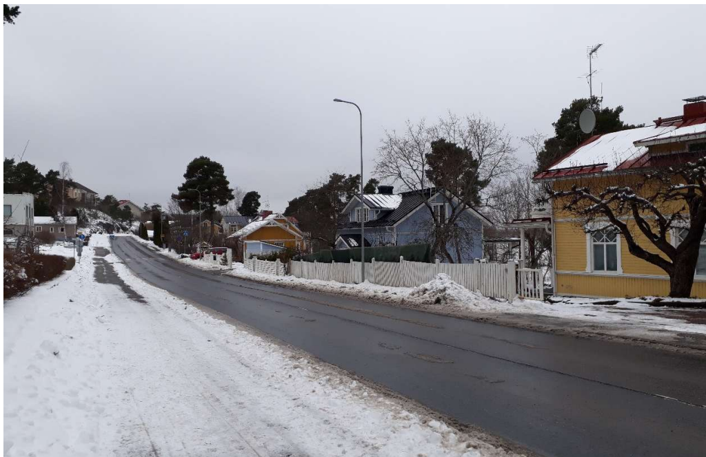
Kuva 3. Suunnittelualan pohjoisosan kaupunkikuvaa kuvattuna idän suunnasta Honkaistentieltä.

Honkaistentien pohjoispuolisella ranta-alueella vanhat huvilat muodostavat melko selkeän rakennuspaikkojen linjan Honkaistentien suuntaisesti lähellä Honkaistentietä. Lähempänä rantaa sijaitsee vastaavasti talous- ja saunarakennusten sekä yksittäisten uudisrakennusten muodostama rakennuspaikkojen Honkaistentien suuntainen linja, ja tämän kaavamuutoksen uudet asuinrakennukset on tarkoitus sijoittaa tälle linjalle. Alueen rakennukset ovat pääasiassa harjakattoisia ja kattoprofiilien suunnat vaihtelevat hieman, valtaosan ollessa Honkaistentien suuntaisia. Asuinrakennukset, autotallit ja aidat rajaavat Honkaistentien pohjoisreunan katutilaa, ja tämä tekee Honkaistentien varren kaupunkikuvasta tiiviin, pienipiirteisen ja vaihtelevan.