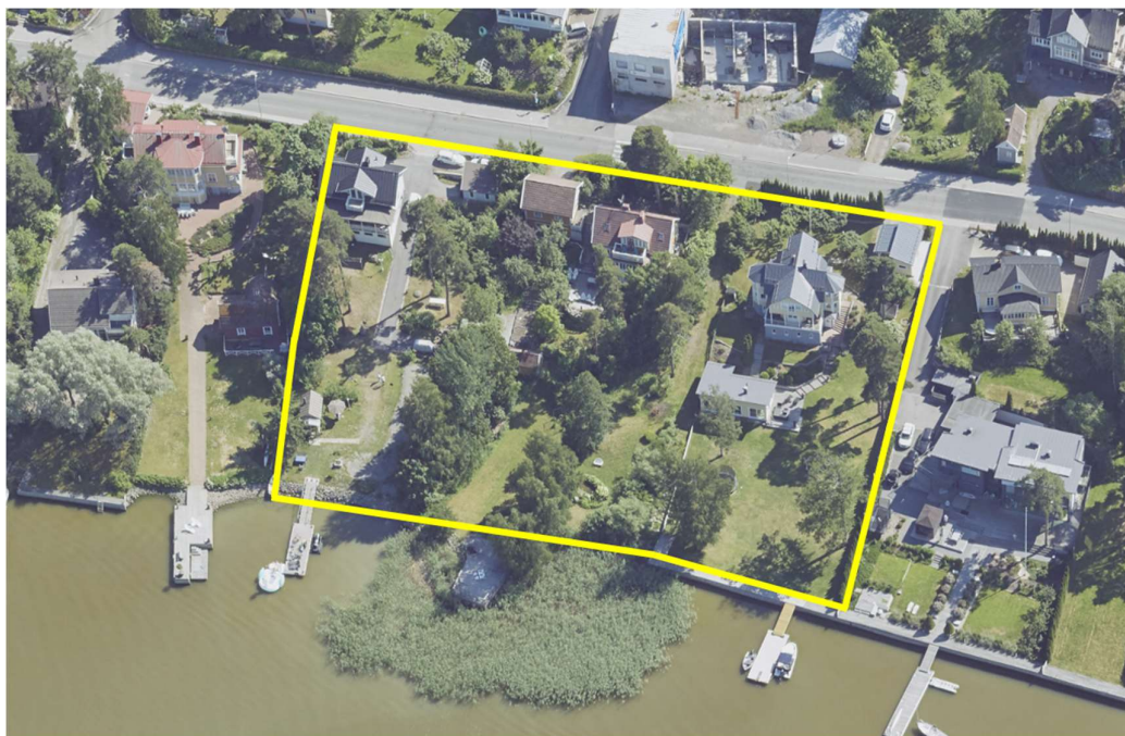
Kuva 2. Suunnittelualueen rakennuskantaa pohjoisesta etelään kuvatussa viistoilmakuvassa. Suunnittelualue suurpiirteisellä keltaisella rajauksella.

Tontti on rakennettua ympäristöä, ja luonnontilaista ympäristöä ei siten ole. Suunnittelualueen pohjoispuolella Suunnittelualueella tai sen läheisyydessä ei ole suojeltavia lajeja tai luontotyyppisiä. Alueen rantaviiva on rakennettua laituri-aluetta lukuun ottamatta tonttia 8, jonka edustalla on kaislikkoa kasvavaa ja osin rakennettua vesijättömaata, mutta tämä alue ei sisälly kaava-alueeseen.