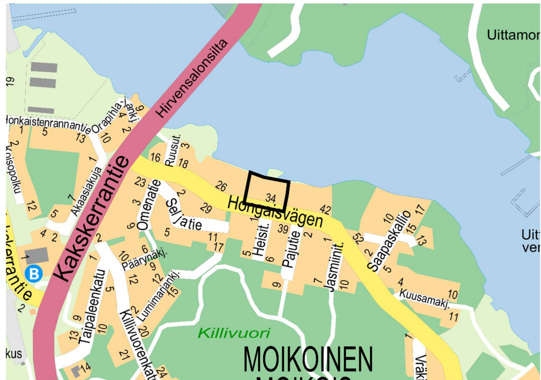
Kuva 1. Kaava-alueen sijainti opaskartalla.

Asemakaavamuutos laaditaan kartassa rajauksella osoitetulle alueelle Moikoisten kaupunginosaan. Kaava-alue sijaitsee noin 3,8 kilometriä kauppatorista lounaaseen.