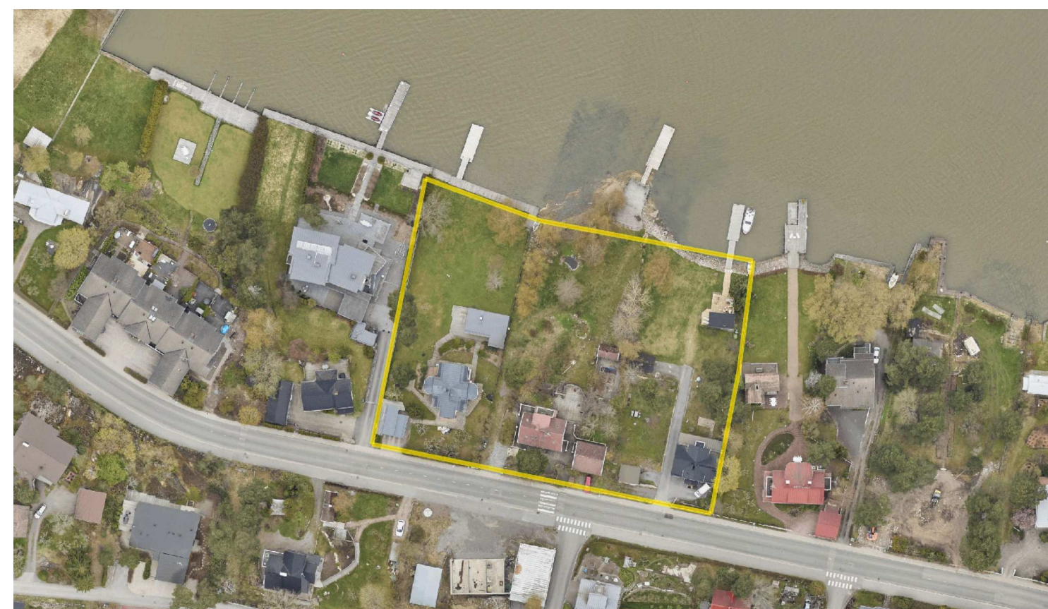
ILMAKUVA © Turun kaupunki