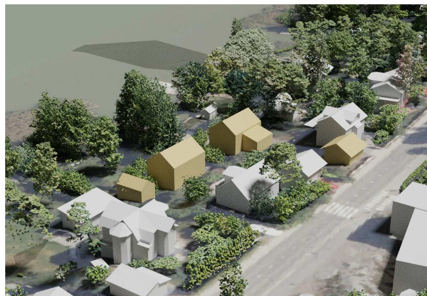
HAVAINNEKUVA © Turun kaupunki (tekijä: Miro Pietilä)