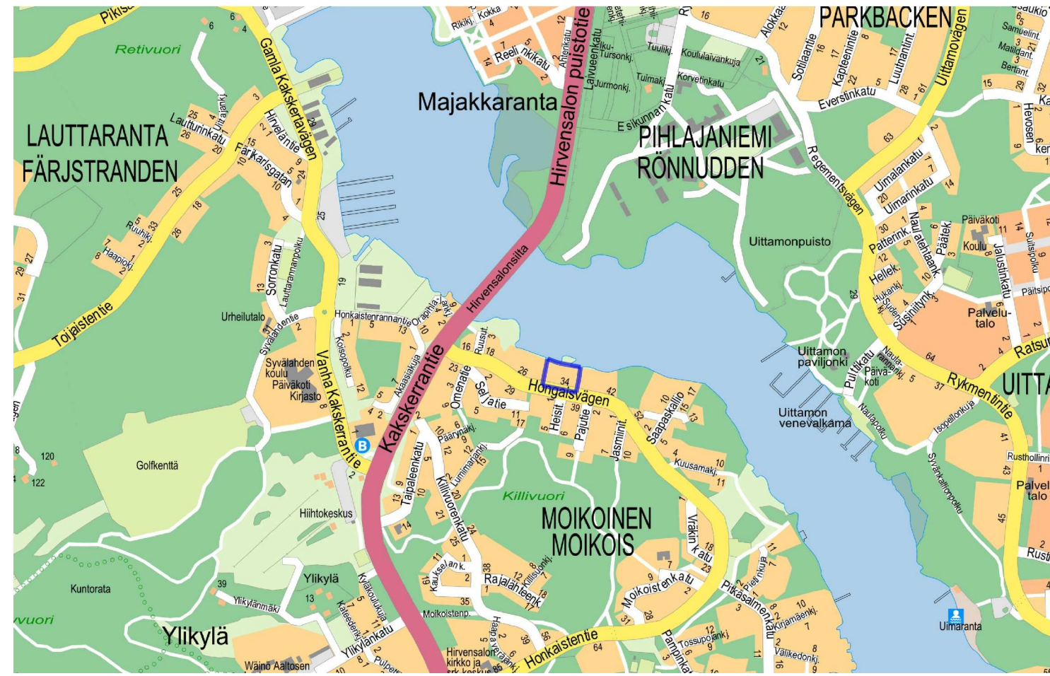
SUAJINTIKARTTA © Turun kaupunki