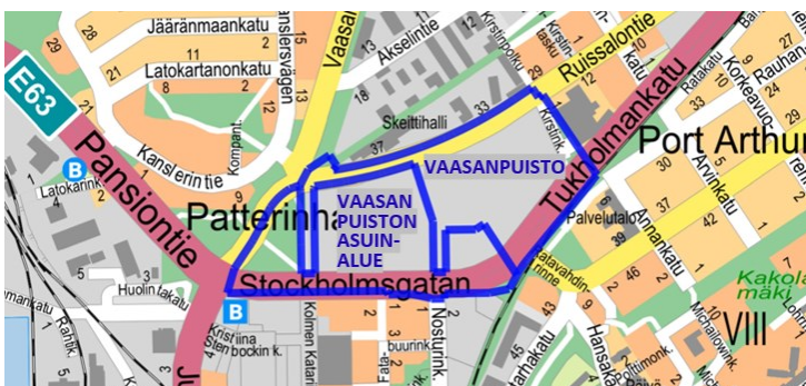
Kuva 2. Vaasanpuiston ja Vaasanpuiston asuinalueen kaavarajaukset. © Turun kaupunki

Vaasanpuiston kaava-alue oli alun perin laajempi, mutta se jaettiin helmikuussa 2025 kahteen osaan. Toisen osan työnimeksi tuli Vaasanpuiston asuinalue. Jako on esitetty kuvassa 2. Jakamisella varmistetaan, että Linnakaupungin monitoimitalon edellyttämä kaavamuutos valmistuu rakennuksen toteutuksen vaatimassa aikataulussa.