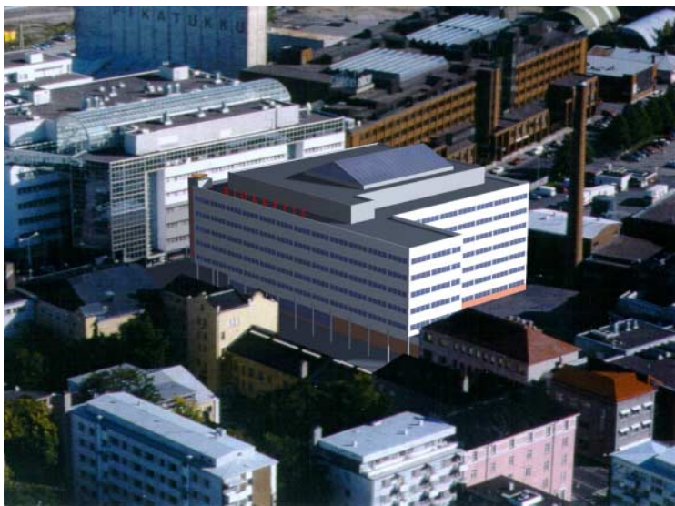
Havainnekuva. Kuvamanipulaatio/Arkkitehtitoimisto JMH