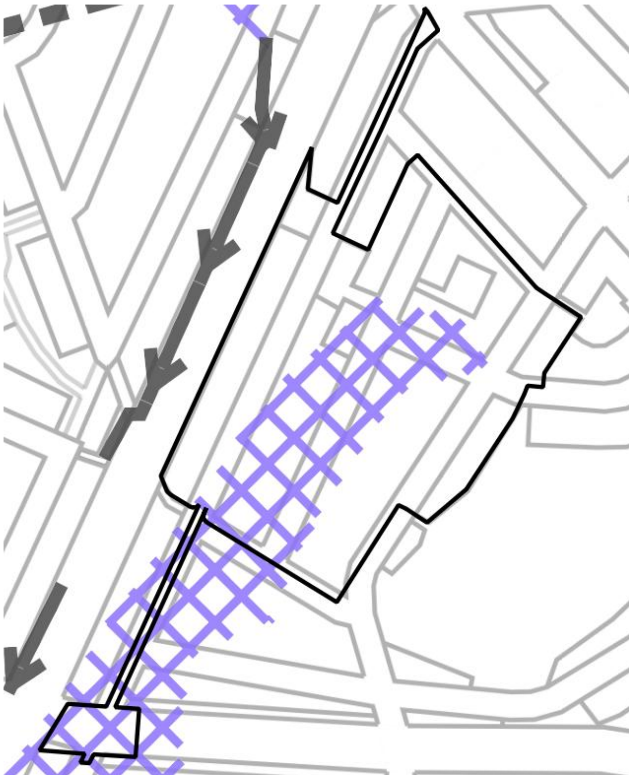
Kuva 3. Ote yleiskaavan kartasta 5, kestävä vesien hallinta © Turun kaupunki.

Turun yleiskaava 2029 on tullut voimaan 10.8.2024. Yleiskaavassa suunnittelualue on asuinalue (A). Yleiskaavan Kartassa 5, Kestävä vesien hallinta, osa alueesta on merkitty hulevesitulvien riskialueeksi.