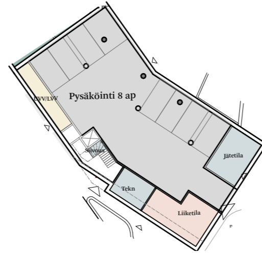
Kortteli 30, 1. kerros: 8 ap, sis. 1 kpl le-ap