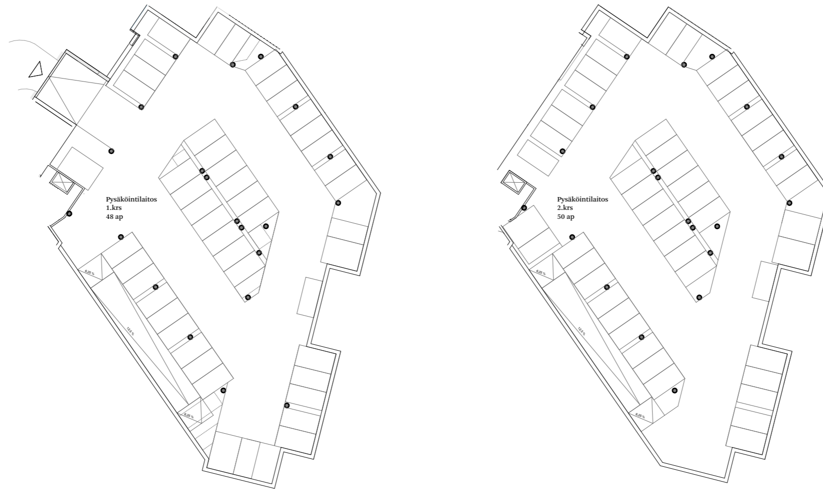
Kortteli 31, 1. ja 2. kerros, 98 ap, sis. 6 kpl le-ap