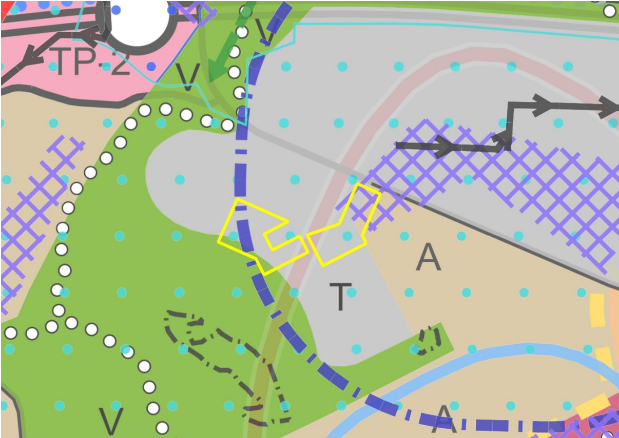
Kuva 3. Ote Yleiskaava 2029:n (ei vielä lainvoimainen) kartoista 1, 5, 6 ja 7.

Kaupunginvaltuuston 13.2.2023 § 27 hyväksymässä Yleiskaava 2029:ssä (ei vielä lainvoimainen) alue on kartalla 1 teollisuus- ja varastoaluetta (T), asuinalue (A) ja virkistysaluetta (V). Kartalla 5 on hulevesitulvavaara-alueen itäosassa. Kartalla 6 on merkinnät kemikaalilaitoksen konsultointivyöhyke (alueen itäosa) ja vesihuollon toiminta-alue.