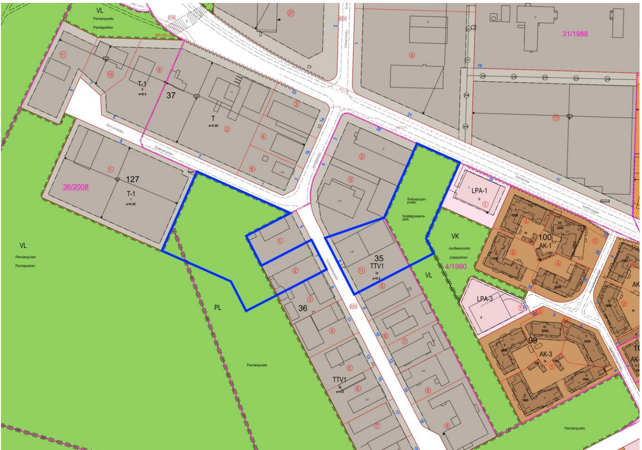
Kuva 4. Ote ajantasa-asemakaavasta.