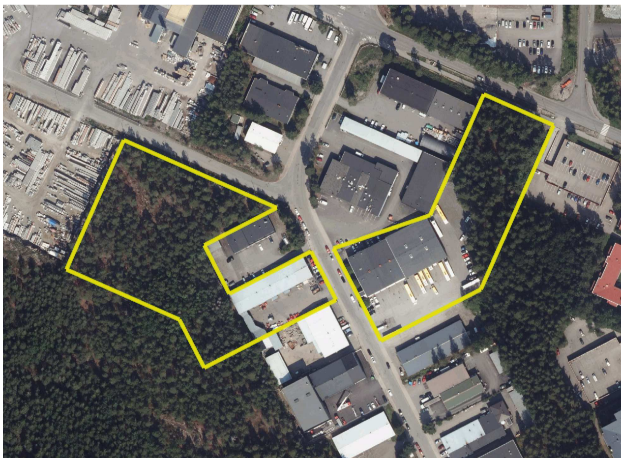
ILMAKUVA © Turun kaupunki