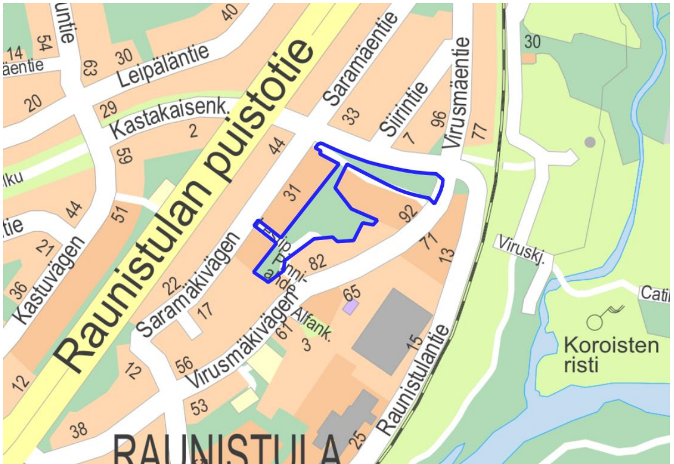
Kuva 1. Kaava-alueen sijainti.

Kaupunginosa: Raunistula Osoite: Lestipolku, Raunistulantie