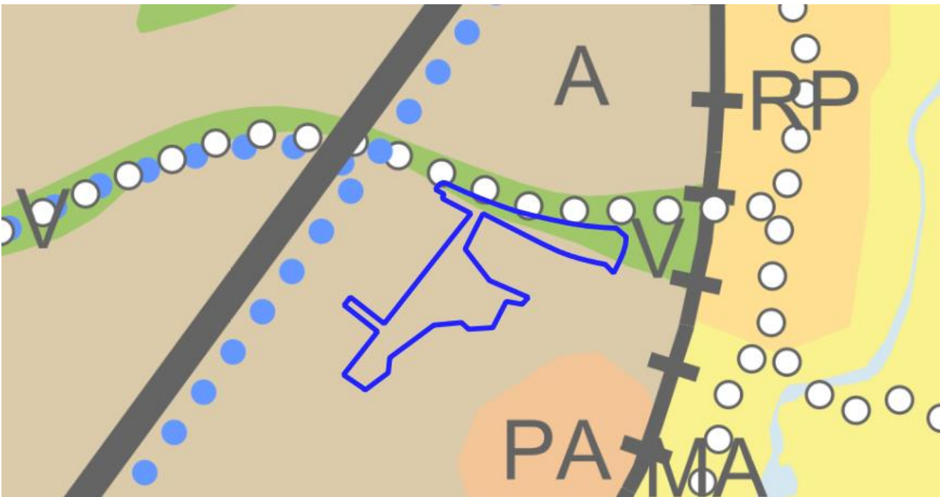
Kuva 2. Ote Yleiskaavan 2029 Yhdyskuntarakenne -kartasta.

Asemakaavassa alueen pohjoisosassa on Viruspiennar-niminen suojaviheralue (EV). Alueen eteläosa, Virusmäenpuisto on lähivirkistysaluetta (VL). Lähivirkistysalueen eteläiseen reunaan on osoitettu kulkuyhteys Lestipolku, joka haarautuu vielä Pinniahde-nimiseksi poluksi. Kulkuväylät on nykyisellään toteutettu osana puistoa.