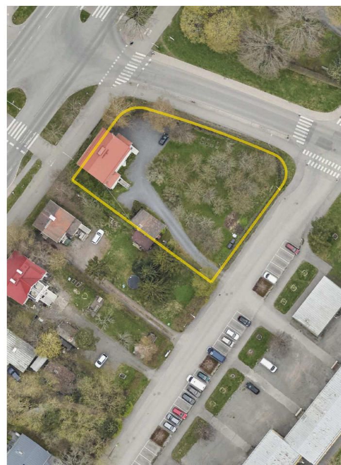
ILMAKUVA © Turun kaupunki