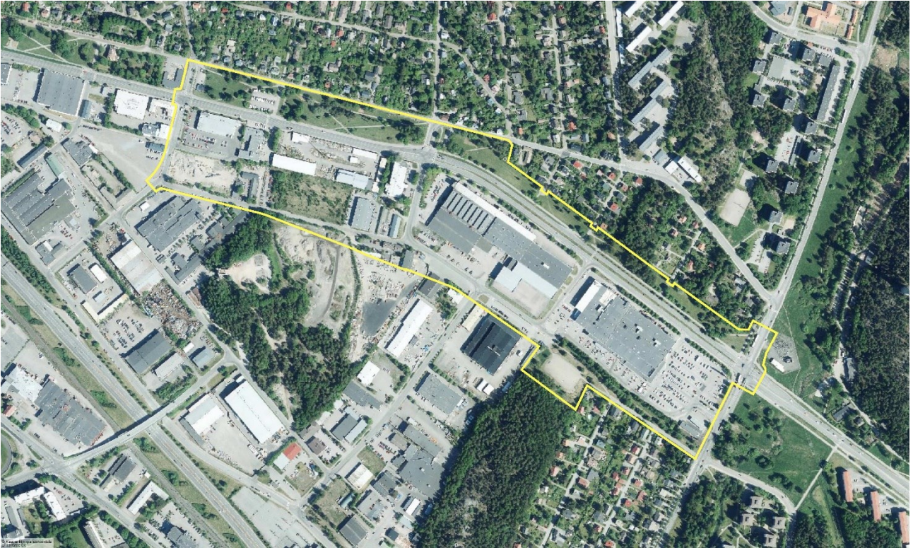
Ilmakuva (suunnittelualue keltaisella rajauksella)