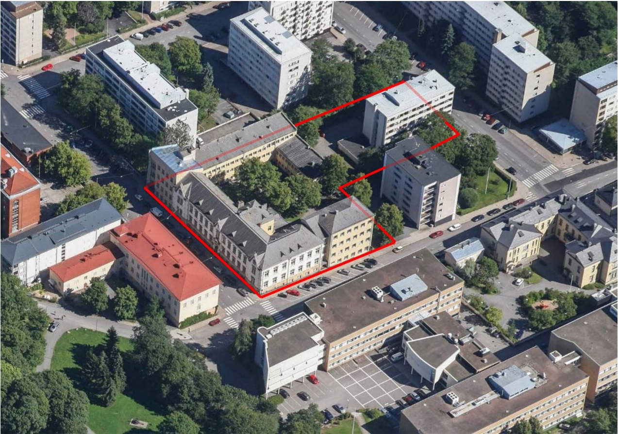
Viistoilmakuva lännestä (suunnittelualue punaisella rajauksella)

Tontin 6 omistaa Asunto Oy Sirkkalankatu 35. Tontilla sijaitsee vuonna 1964 rakennettu seitsemäkerroksinen asuinkerrostalo ja autotallirakennus.