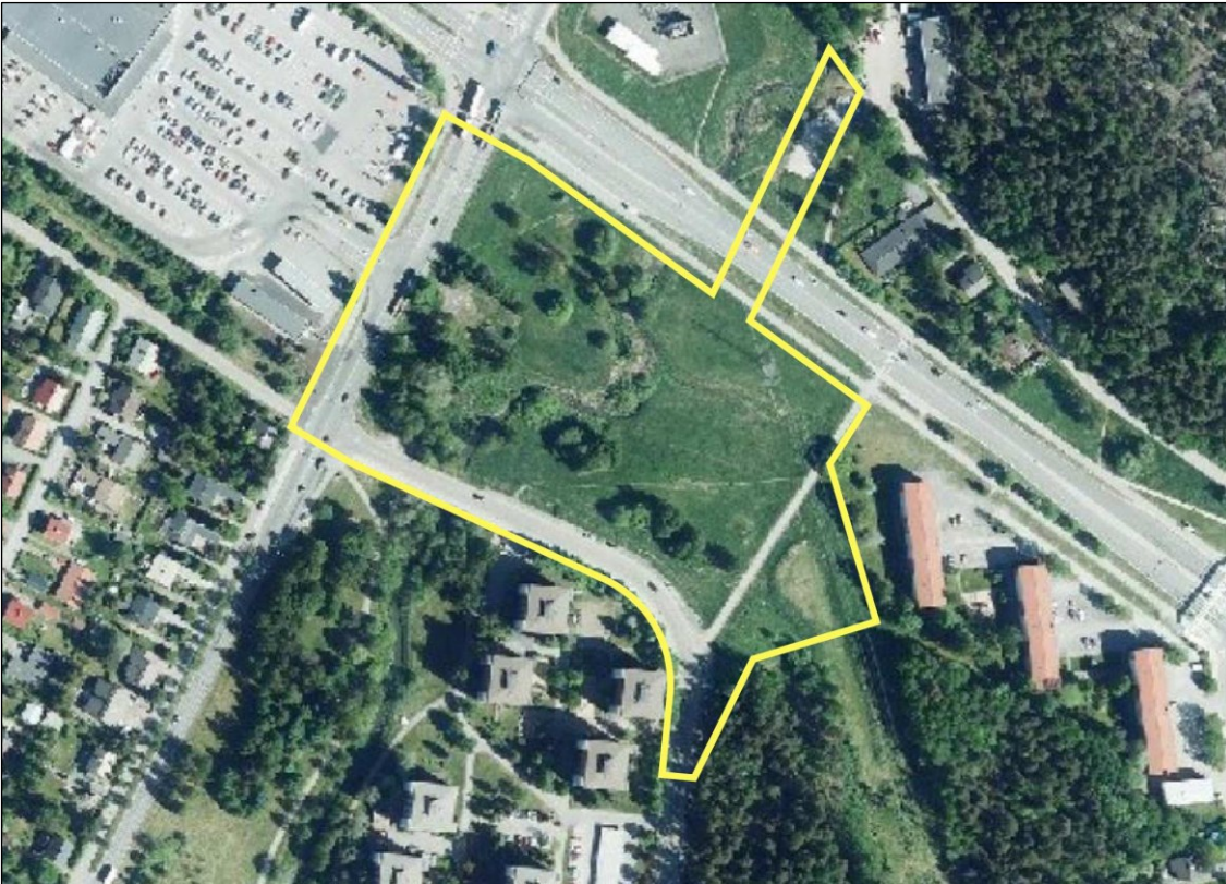
Kuva 2. Ilmakuva alueesta