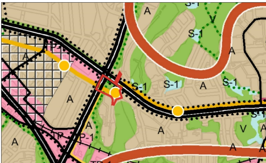
Kuva 4. Ote yleiskaava 2029 -luonnoksesta