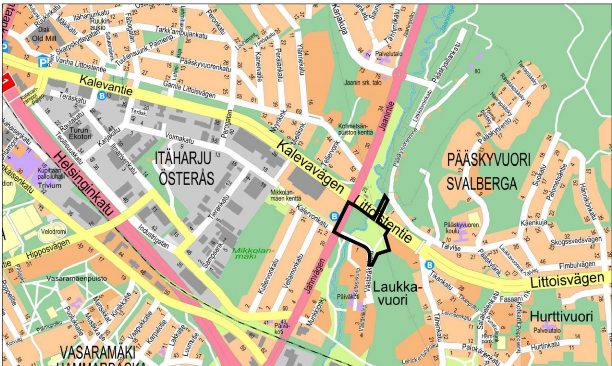
Kuva 1. Kaava-alueen sijainti opaskartalla.

Kaupunginosat: (012) Itäharju ja (015) Pääskytuori Osoite: Littoistentie