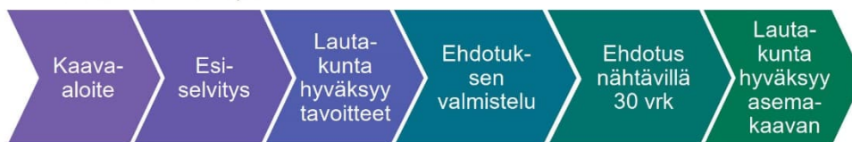
M-kokoisen kaavan prosessi

Osallisia kaavan valmistelussa ovat alueen maanomistajat ja ne, joiden asumiseen, työntekoon ja muihin oloihin kaava saattaa huomattavasti vaikuttaa, sekä viranomaiset ja yhteisöt, joiden toimialaa suunnittelussa käsitellään. Tämän hankkeen osalta osallisiksi on arvioitu seuraavat tahot: