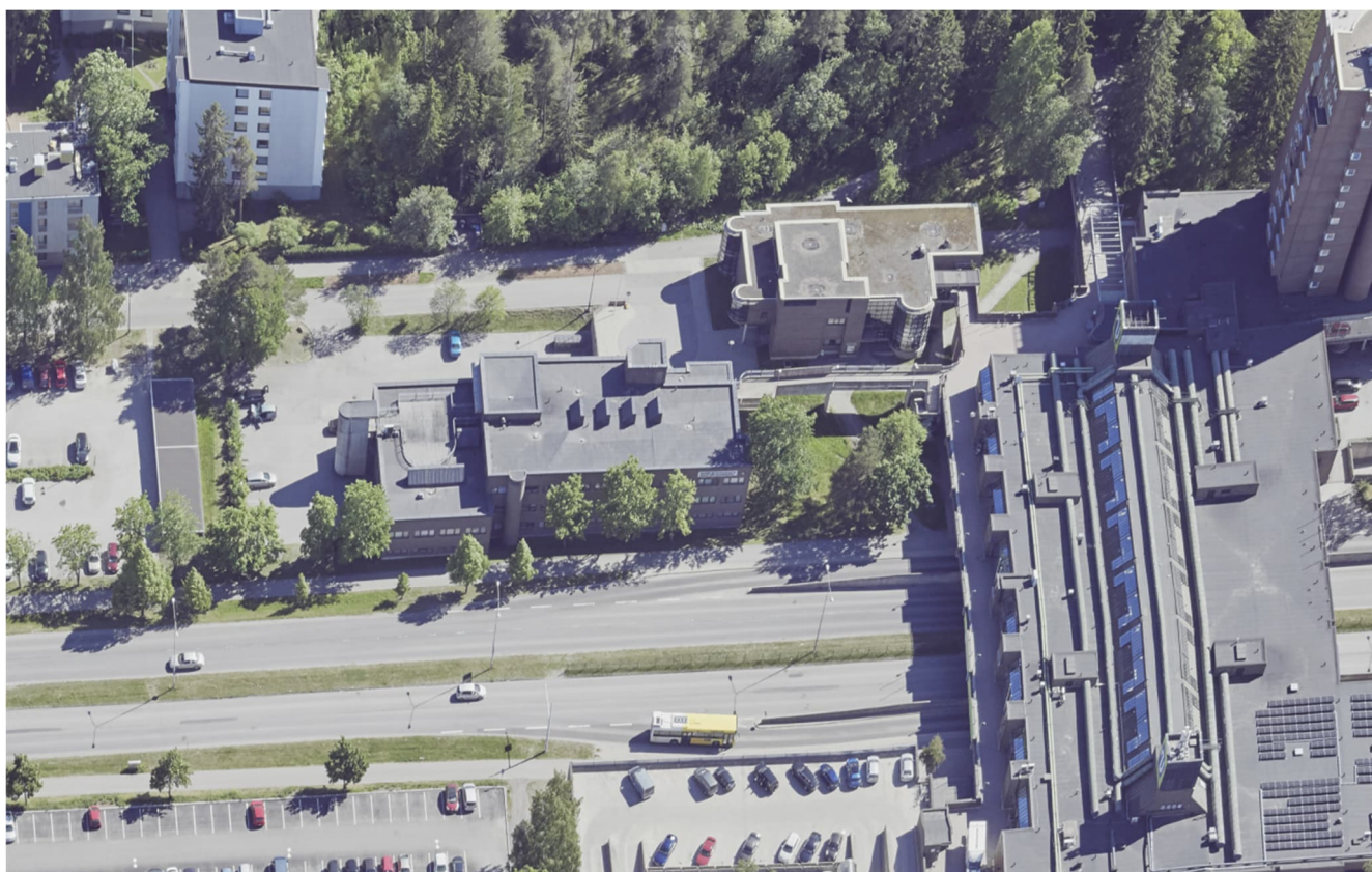
Kuva 4. Viistokuva etelän suunnalta.