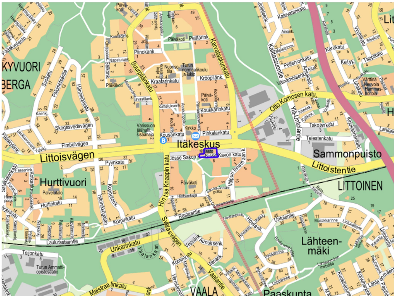
Kuva 1. Kaava-alueen sijainti.