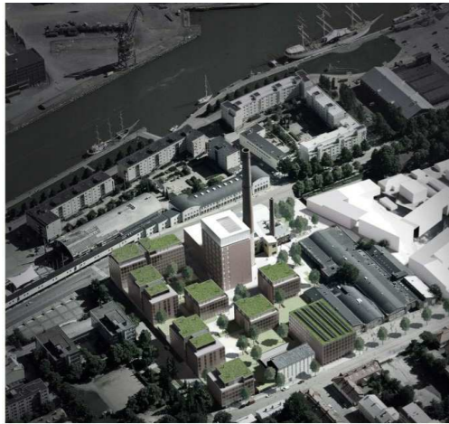
Havainnekuva tontinkäyttösuunnitelmasta "Rasteri" / Sigge Arkkitehdit Oy

Poistuvan kaavan tunnus ja voimaantulopäivä.