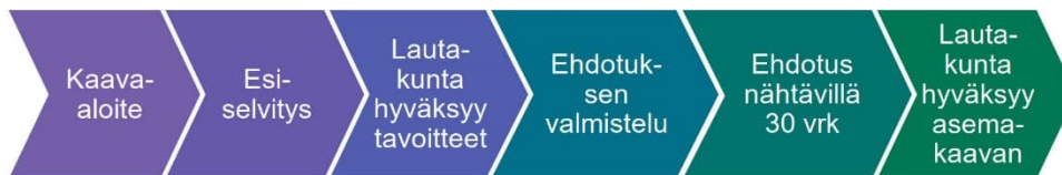
M-kokoisen kaavan prosessi

Osallisia kaavan valmistelussa ovat alueen maanomistajat ja ne, joiden asumiseen, työntekoon ja muihin oloihin kaava saattaa huomattavasti vaikuttaa, sekä viranomaiset ja yhteisöt, joiden toimialaa suunnittelussa käsitellään. Tämän hankkeen osalta osallisiksi on arvioitu seuraavat tahot: