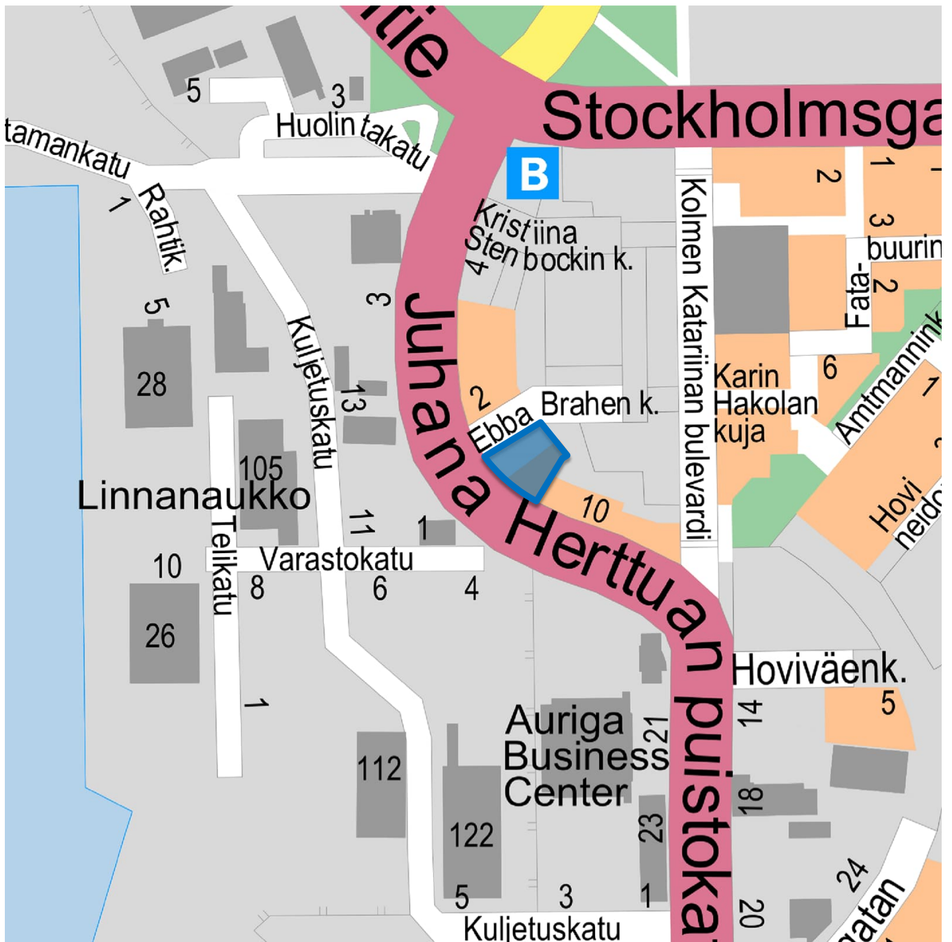
Kuva 1. Kaava-alueen sijainti.