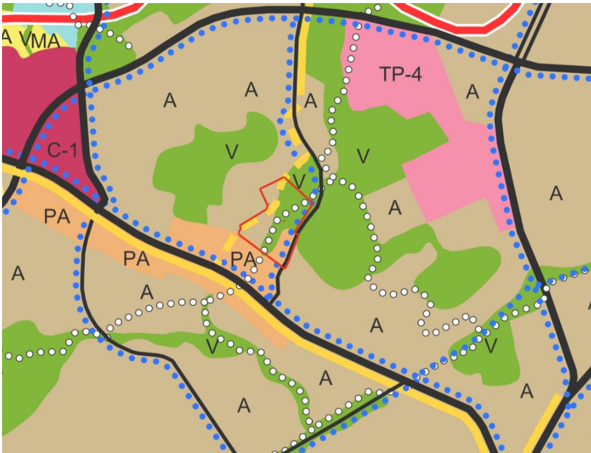
Kuva 3. Ote yleiskaava 2029 ehdotuksesta päivätty 24.11.2021, muutettu 20.12.2021 (KH § 582), muutettu 1.8.2022 (lausunnot ja muistutukset), suunnittelualue punaisella rajauksella.

Suunnittelualueella on voimassa seuraavat asemakaavat :