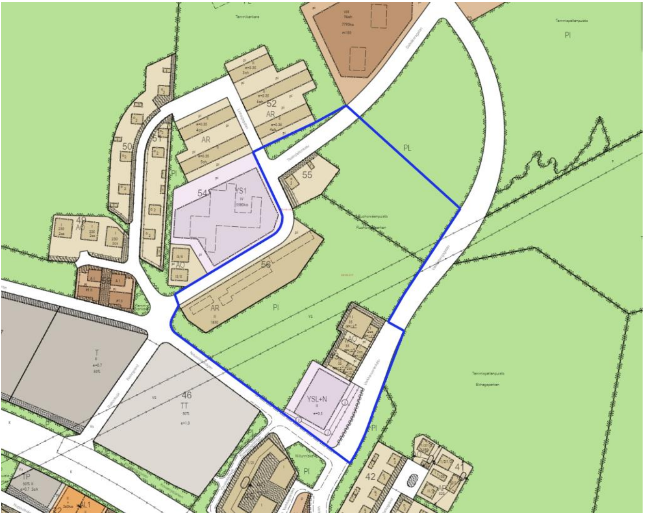
Kuva 4. Ote ajantasa-asetmakaavasta (suunnittelualue sinisellä rajauksella)