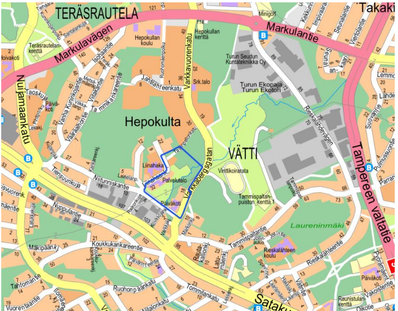
Kuva 1. Kaava-alueen sijainti.

Osoite: Liinahaankatu 28-32, Niitunniskantie 1, Varkkavuorenkatu 10-18 ja Taalinpellonkatu