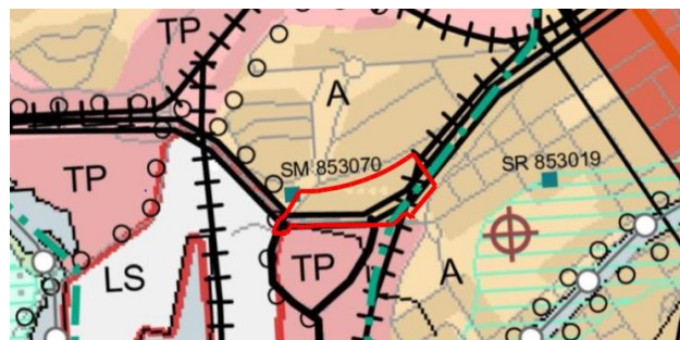
Kuva 4. Maakuntakaava

Maakuntakaavassa muutosalue on taajamatoi- mintojen aluetta (A).