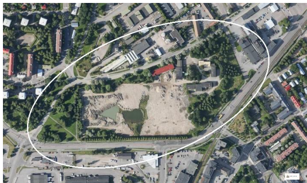
Kuva 2. Ilmakuva suunnittelualueesta

Asemakaavanmuutos laaditaan kartassa osoitetulle alueelle Iso-Heikkilän kaupunginosaan, vuonna 2009 lakkautetun vedenpuhdistamon alueelle ja osalle Vaasanpuistoa. Suunnittelu- aluetta rajaavat Kirstinkatu idässä, Tukholman- katu kaakossa, Pansiontie etelässä, Vaasantie lännessä ja Ruissalontie pohjoisessa. Alueen koko on n. 9,9 ha.