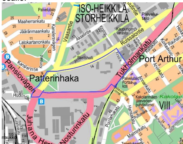
Kuva 1. Suunnittelualueen rajaus

Asemakaavanmuutos laaditaan Iso-Heikkilän kaupunginosan korttelille 42 ja Vaasanpuiston osalle.