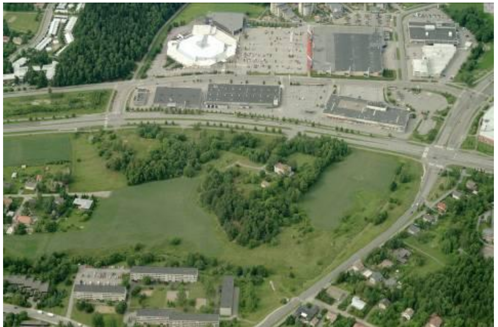
Kaava-alue itä, Suikkilan kartano, Länsikeskus, Satakunnantien ja Suikkilantien risteys