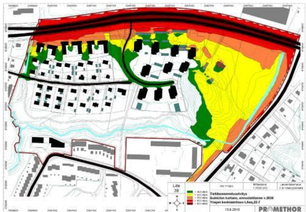
Kuva 9. Tieliikenneluseselvitys, Suikkilan kartano, ennustetilanne v. 2030. Yöajan keskiäänitaso L_{Aeq} , 22–7 (Promethor Oy 2010).

Satakunnantien puoleisten julkisivujen ääneneristävyysvaatimukset on määritetty tavanomaisesti päivän keskiäänitason perusteella ja vaatimus on AR-1-alueella (asuinrivitalojen ja muiden kytkettyjen asuinrakennusten kortteli-alue) 34 dBA ja AK-alueella (asuinkeuhkotalojen kortteli-alue) enimmillään 32 dBA.