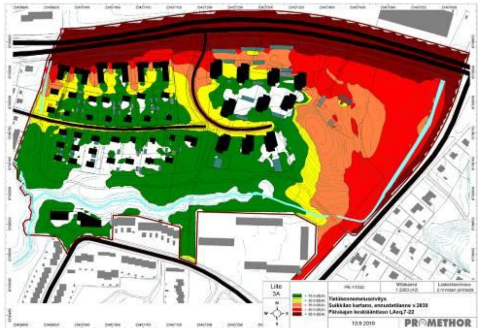
Kuva 8. Tieliikenneluseselvitys, Suikkilan kartano, ennustetilanne v. 2030. Päiväajan keskiäänitaso L_{Aeq} , 7–22 (Promethor Oy 2010).