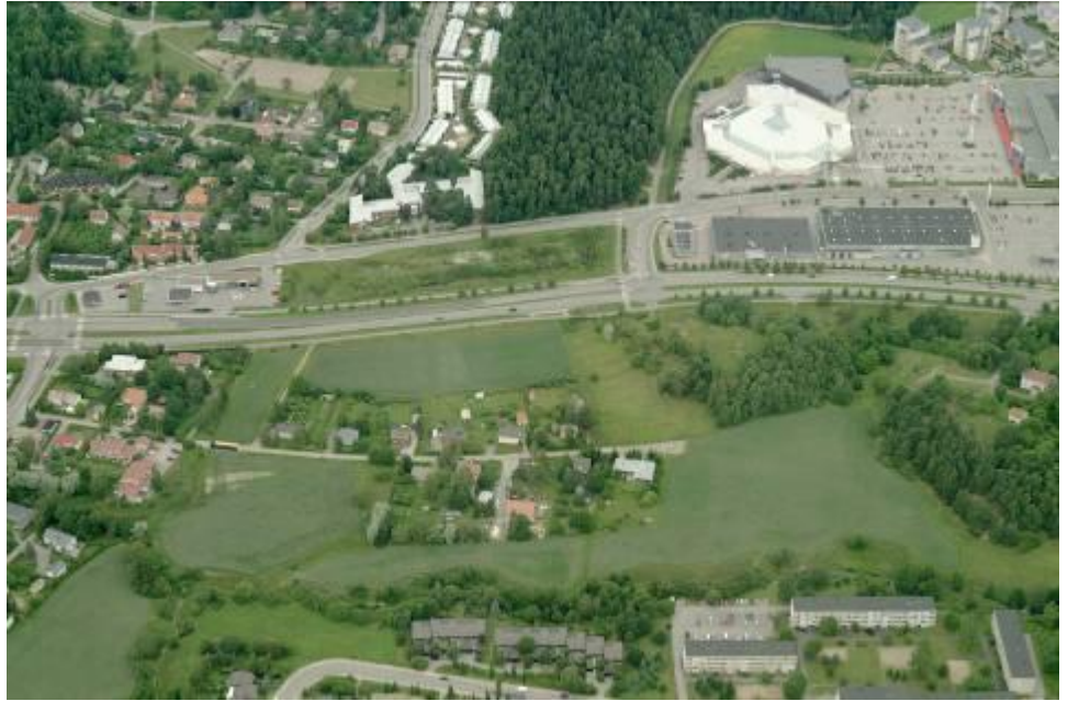
Kaava-alue länsi, pientaloalue Pirttilähteenkatu, Satakunnantie, Länsikeskus