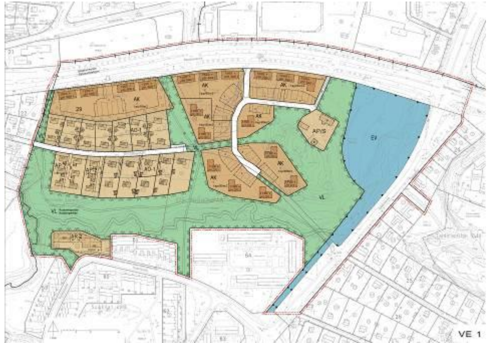
Kuva 5. Asemakaavamuutoksen luonnosvaihtoehto 1.

Asemakaavamuutoksen luonnosvaihtoehto 1 pohjautuu Viiva Arkkitehtuuri Oy:n suunnitelmaan. Aikaisemmassa kaavoitusvaiheessa asukkaat ovat vastustaneet sitä, koska se perustuu kokonaan kerrostalorakentamiseen.