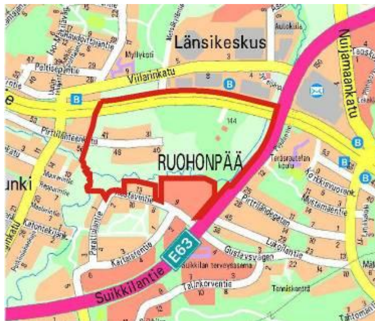
Kuva 1. Kaava-alueen rajaus.