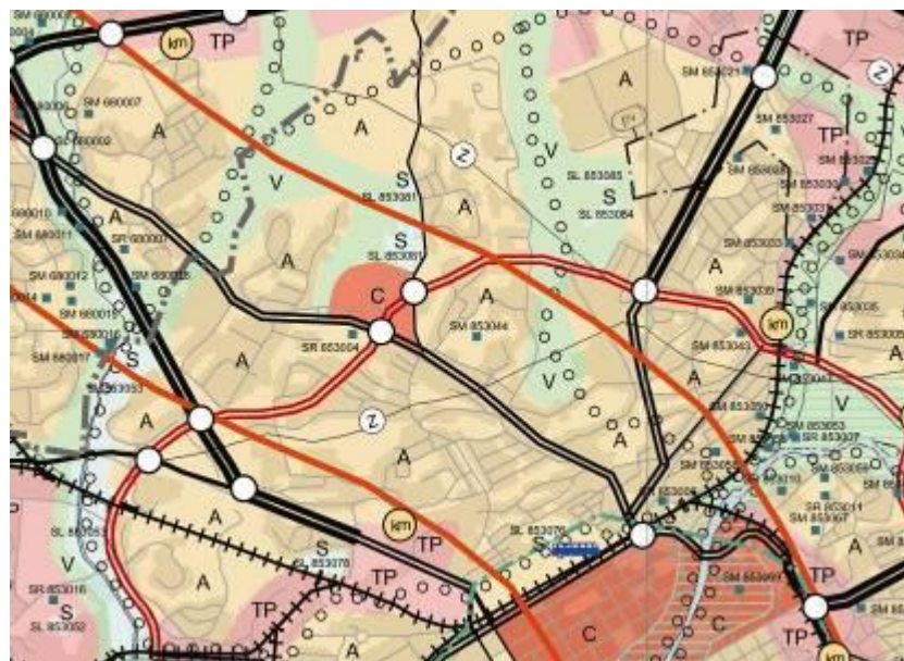
Kuva 2. Ote maakuntakaavasta.