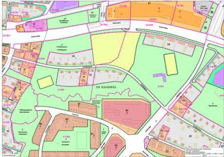
Kuva 4. Ote ajantasa-asemakaavasta.

Voimassa olevissa asemakaavoissa alue on pääosin puistoa ja viljelystonttikortteleita. Kaavan Satakunnantien varrelle osoittama asuin- ja liikerakennusten korttelialue ei ole toteutunut. Myös osa kaavanmukaisesta, alueen poikki kulkevasta Pirttilähteenkadusta on toteuttamatta, samoin kuin osa sen varrelle osoitetuista asuinrakennusten rakennusaloista.