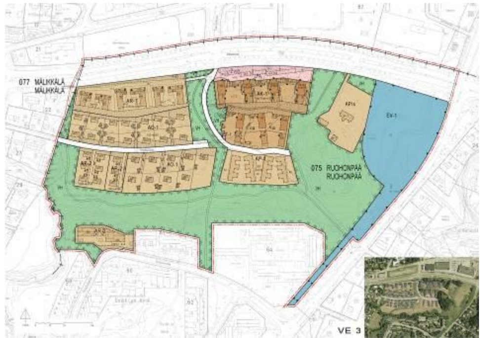
Kuva 7. Asemakaavamuutoksen luonnosvaihtoehto 3.

Ympäristö- ja kaavoitusvirasto on laatinut luonnosvaihtoehdon 3 keväällä 2007. Suunnitelmaa tehtäessä asemakaavatoimistolla on ollut käytettävissä osallisten osallistumis- ja arviointisuunnitelmavaiheessa jättämät mielipiteet ja niitä on otettu huomioon suunnittelun yhteydessä. Mielipiteistä erityisesti esiin nousivat näkemykset rakentamisen korkeudesta ja määrästä, yleiskaavassakin osoitettujen viherväyliä turvaamisesta sekä alueen viihtyisyydestä ja vehreydestä. Myös Viiva Arkkitehtuuri Oy:n ja Arkkitehtitoimisto Jarmo Saarinen Oy:n siihen mennessä laatimien suunnitelmaversioiden ongelmakohdat olivat tiedossa.