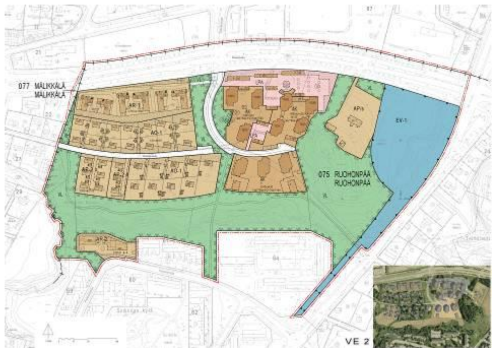
Kuva 6. Asemakaavamuutoksen luonnosvaihtoehto 2.

Asemakaavamuutoksen luonnosvaihtoehto 2 perustuu olennaisilta osiltaan varaajien konsulttityönä teettämään suunnitelmaan. Suunnitteluvarauksen haltijat ovat tutustuneet osallisten osallistumis- ja arviointisuunnitelmavaiheessa jättämiin sekä myöhemmin jätettyihin mielipiteisiin, joita on osittain pystytty huomioimaan.