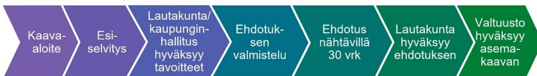
L-kokoisen kaavan prosessi

Osallisia kaavan valmistelussa ovat alueen maanomistajat ja ne, joiden asumiseen, työntekoon ja muihin oloihin kaava saattaa huomattavasti vaikuttaa, sekä viranomaiset ja yhteisöt, joiden toimialaa suunnittelussa käsitellään. Tämän hankkeen osalta osallisiksi on arvioitu seuraavat tahot: