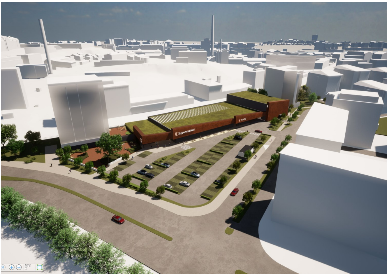
Kuva 2. Aloitteentekijän Schauman Arkkitehdit Oy:ltä tilaama alustava viitesuunnitelma 11.11.2022.

Kiinteistön vuokralaisen Kesko Oyj:n toimeksiannosta Schauman Arkkitehdit Oy on laatinut viitteellisen maankäyttöluonnoksen suunnittelualueesta. Viitesuunnitelman tavoitteena on yhdistää päivittäistavarakauppa ja asuminen keskitetyllä pysäköintirakennuksella, jolla täytetään asukkaiden paikoitus-tarve. Asiakkaiden pihapaikoitus on sijoitettu tontin luoteiskulmaan. Suunnitelmassa pyritään kaupunkikuvallisesti näyttävään kaupparakennukseen, jonne on sujuvat jalankulku- ja pyöräily-yhteydet. Alueen suunnittelua rajoittaa aluetta halkovat suuret hulevesijohdot, jotka rajaavat kolmionmuotoisen alueen Tukholmankadun varresta vaikeasti hyödynnettäväksi.