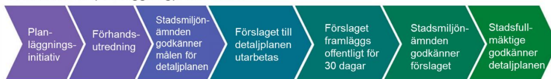
Processen för planläggningprocessen L

Delaktiga i beredningen av planen är markägarna i området och de vars boende, arbete och andra förhållanden planen betydligt kan påverka, samt myndigheter och sammanslutningar vars verksamhetsområde behandlas i planeringen. Gällande detta projekt har följande parter ansetts vara delaktiga :