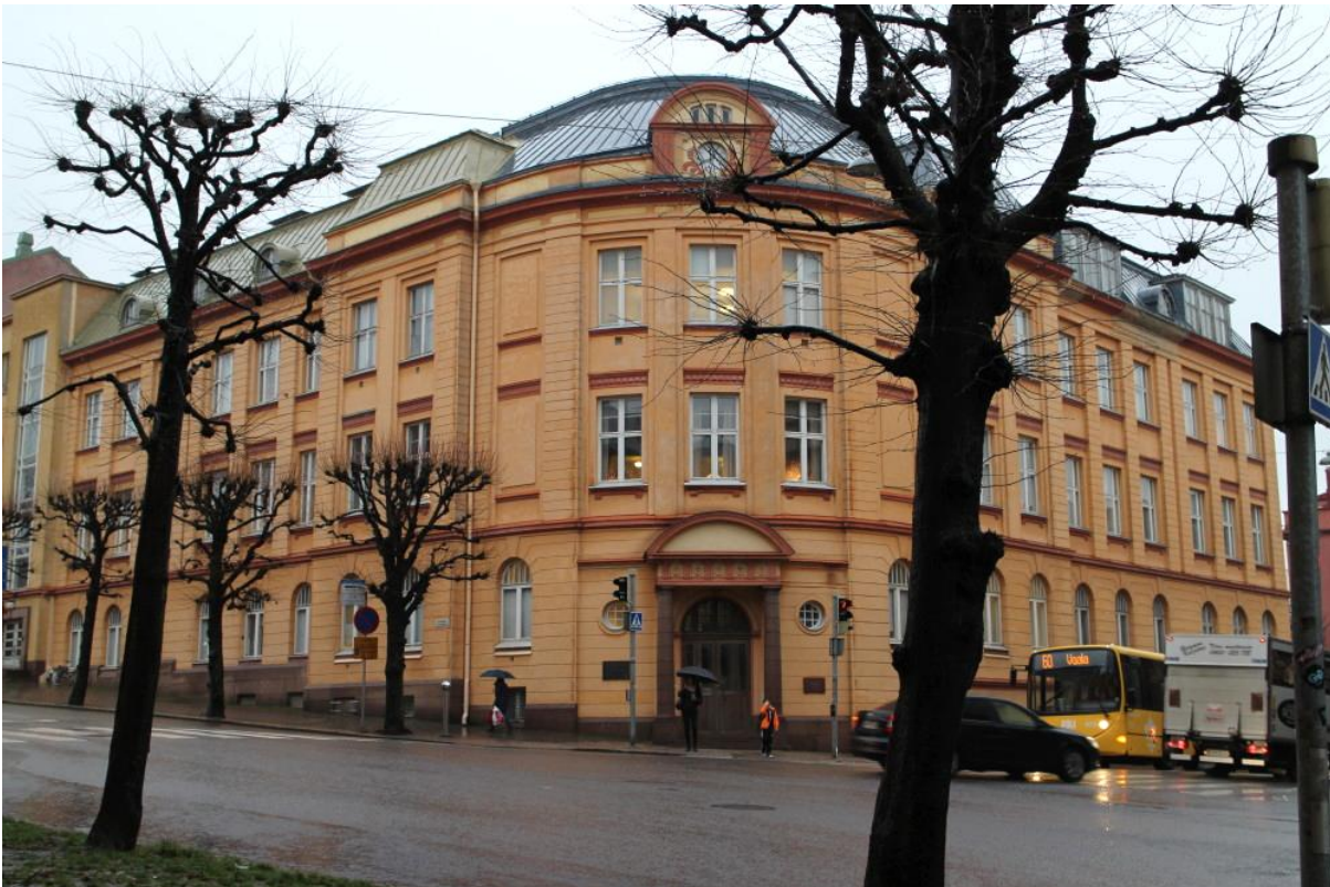
Bild 2. Cygnaeus skola fotograferad från korsningen mellan Auragatan och Mariegatan.

Planområdet ägs av staden. Planområdet ligger delvis i kvarterets brandgatuområde och det finns några träd och planteringar i planområdet. Det finns knappt några vattengenomträngliga ytor på kvarterets innergård. På tomten där Puolalan koulus enhet på Köpmansgatan ligger finns det områden som kan vara förorenade eller innehålla skadliga ämnen. Skoltomterna har för närvarande gemensamma arrangemang för förbindelseleder och parkering. De gemensamma arrangemangen utreds i samband med planändringen.