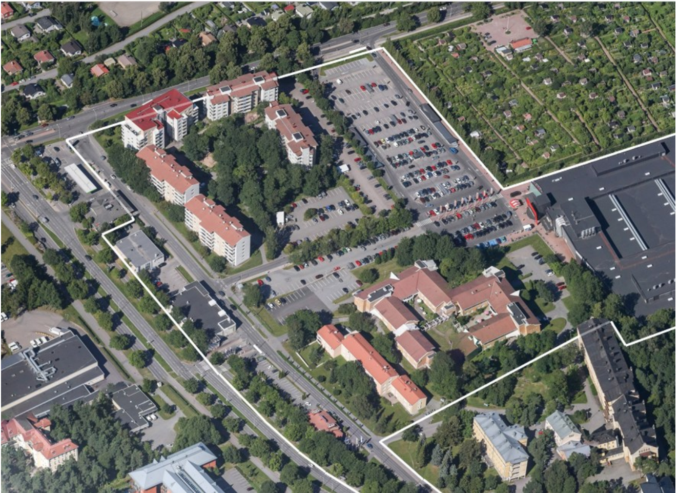
Kuva 2. Ilmakuva (suunnittelualue valkoisella rajauksella).

Alueen yhdeksästä tontista kolme on kaupungin omistuksessa. Yksi kaupungin tonteista on vuokrattu pitkäaikaisella vuokrasopimuksella Kesko Oyj:lle ja tontilla toimii Kupittaaan Citymarket. Kurjenmäenkadun ja Kaskentien välisellä alueella on liikerakennuksia ja Kingelininkadun ja Kunnallissairaalan välissä asuinrakennuksia. Kingelininkadun eteläpuolella toimii vanhustaloyksikkö Kurjenmäkikoti sekä Tyksin psykiatrian toimialueen yksikkö.