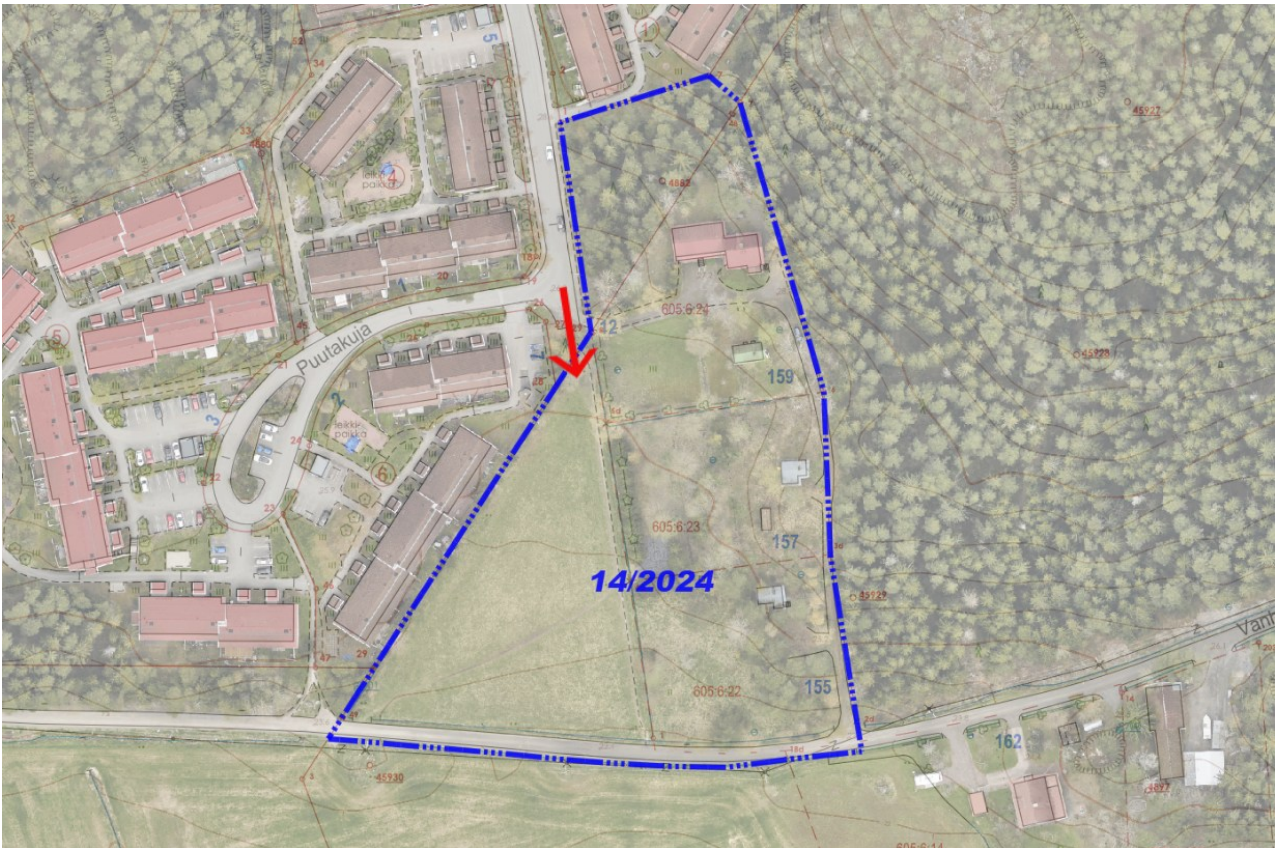
Yleisötilaisuuden sijainti Hinkalokadun päätteen lähellä.

Asukastilaisuudessa pääsee paikan päällä tarkastelemaan kaavaehdotuskarttaa ja kiertämään kaava-alueella Hinkalokadun ja Vanhan Ravattulantien ympäristössä. Lisäksi kaavoittaja ja rakennusliikkeen edustaja ovat paikalla vastaamassa kysymyksiin.