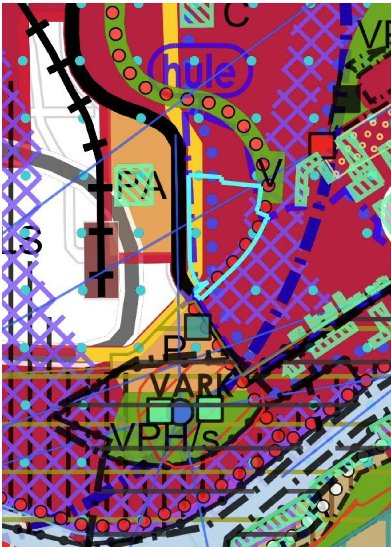
Kuva 2. Ote Yleiskaava 2029:sta, johon on merkitty päivitetty kaavarajaus.