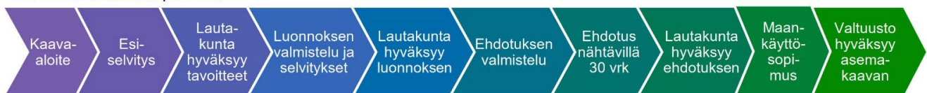
XL-kokoisen kaavan prosessi

Osallisia kaavan valmistelussa ovat alueen maanomistajat ja ne, joiden asumiseen, työntekoon ja muihin oloihin kaava saattaa huomattavasti vaikuttaa, sekä viranomaiset ja yhteisöt, joiden toimialaa suunnittelussa käsitellään. Tämän hankkeen osalta osallisiksi on arvioitu seuraavat tahot: