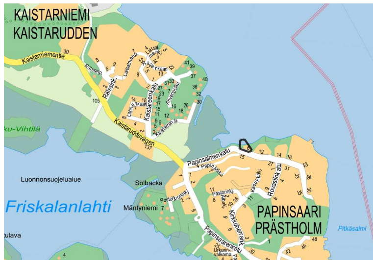
SIJAINTIKARTTA © Turun kaupunki