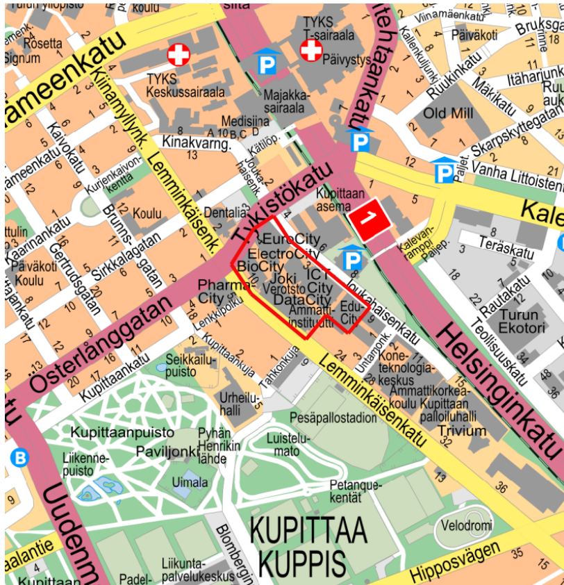
Kuva 1. Kaava-alueen sijainti opaskartalla.

Asemakaavanmuutos laaditaan kartassa rajauksella osoitetulle alueelle, joka sijaitsee Kupittaa kaupunginosassa noin 1,3 kilometrin etäisyydellä Kauppatorilta kaakkoon.