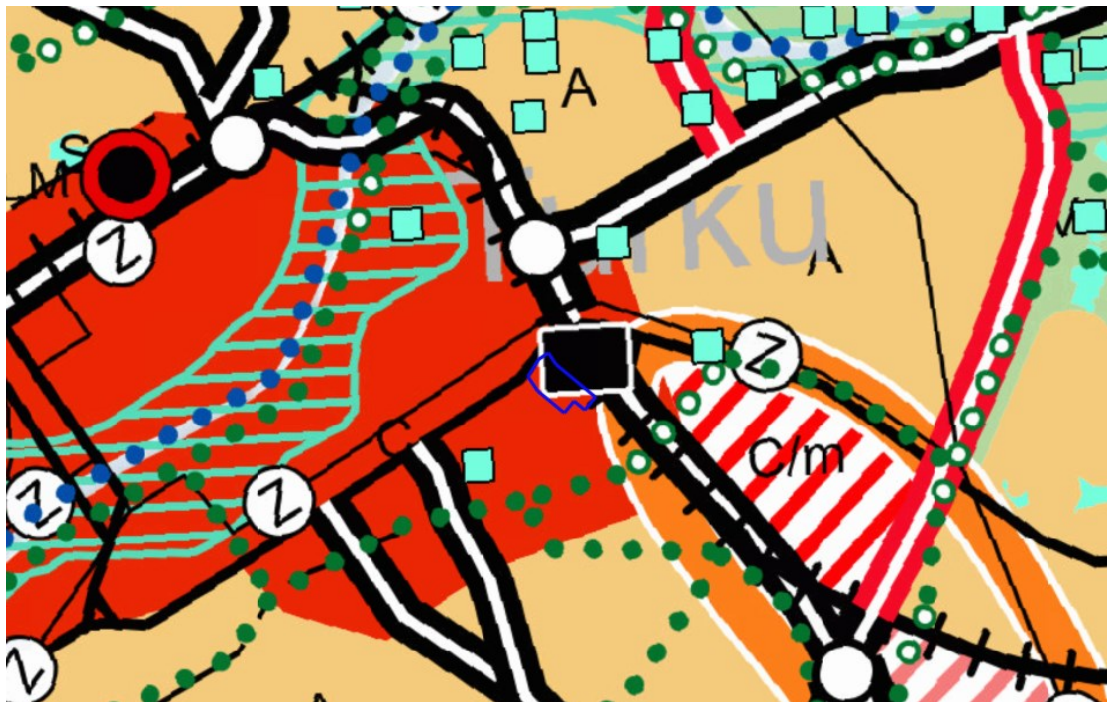
Kuva 2. Ote maakuntakaavayhdistelmästä.

Suunnittelumääräyksen mukaan maankäytön, kestävän liikkumisen, asumisen, palvelujen ja työpaikkatoimintojen yhteensovittavaa kehittämistä tulee edistää kokonaisvaltaisella suunnittelulla. Suunnittelun tulee olla kaupunki- ja taajamakuva eheyttävää ja ominaispiirteet huomioivaa. Suunnittelulla tulee varmistaa seudullisesti merkittävän vähittäiskaupan edellytykset olemassa olevia rakenteita kehittäen.