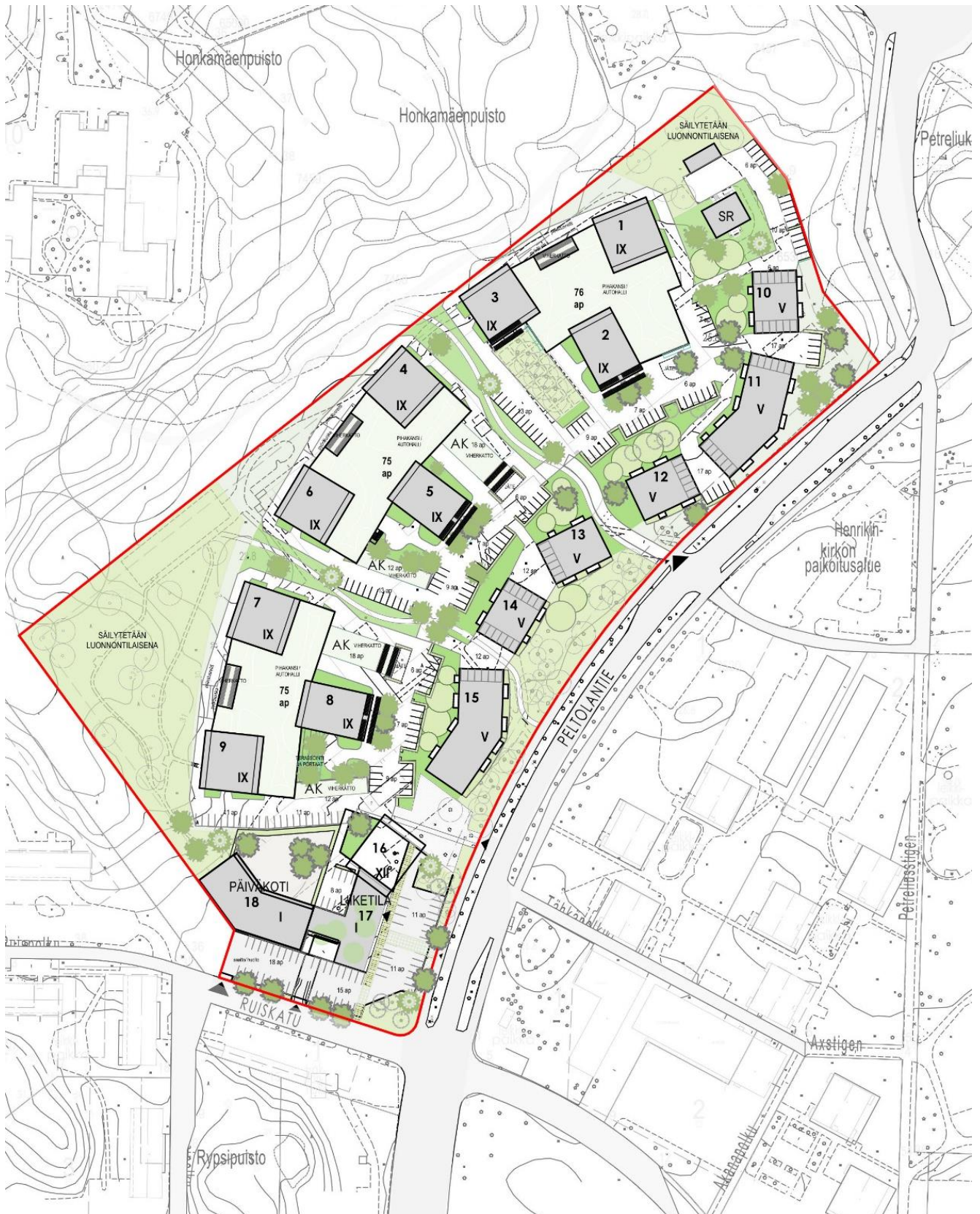
Kuva 3. Asemapiirrosluonnos uudesta asuinalueesta (Schauman Arkkitehdit Oy, toukokuu 2022).

Alustavien luonnosten perusteella alueelle voisi sijoittua enintään noin 1 100 asukasta. Suuri osa asunnoista suunnitellaan perheasunnoiksi, joissa on vähintään kaksi makuuhuonetta.