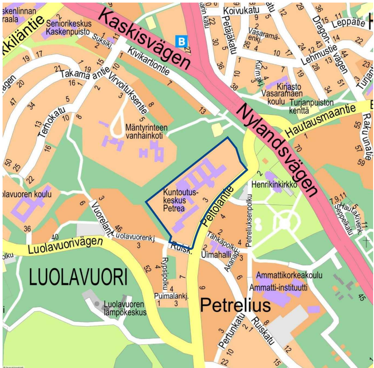
Kuva 1. Kaava-alueen sijainti.

Kaupunginosa: Luolavuori Osoite: Peltolantie 3