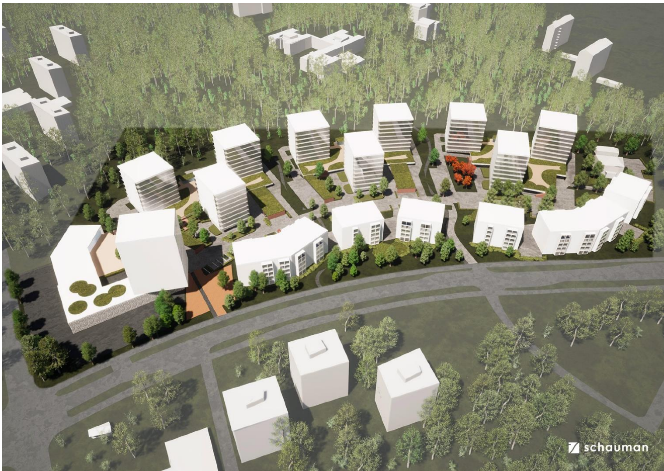
Kuva 4. Havainnekuva uudesta asuinalueesta (Schauman Arkkitehdit Oy, toukokuu 2022).