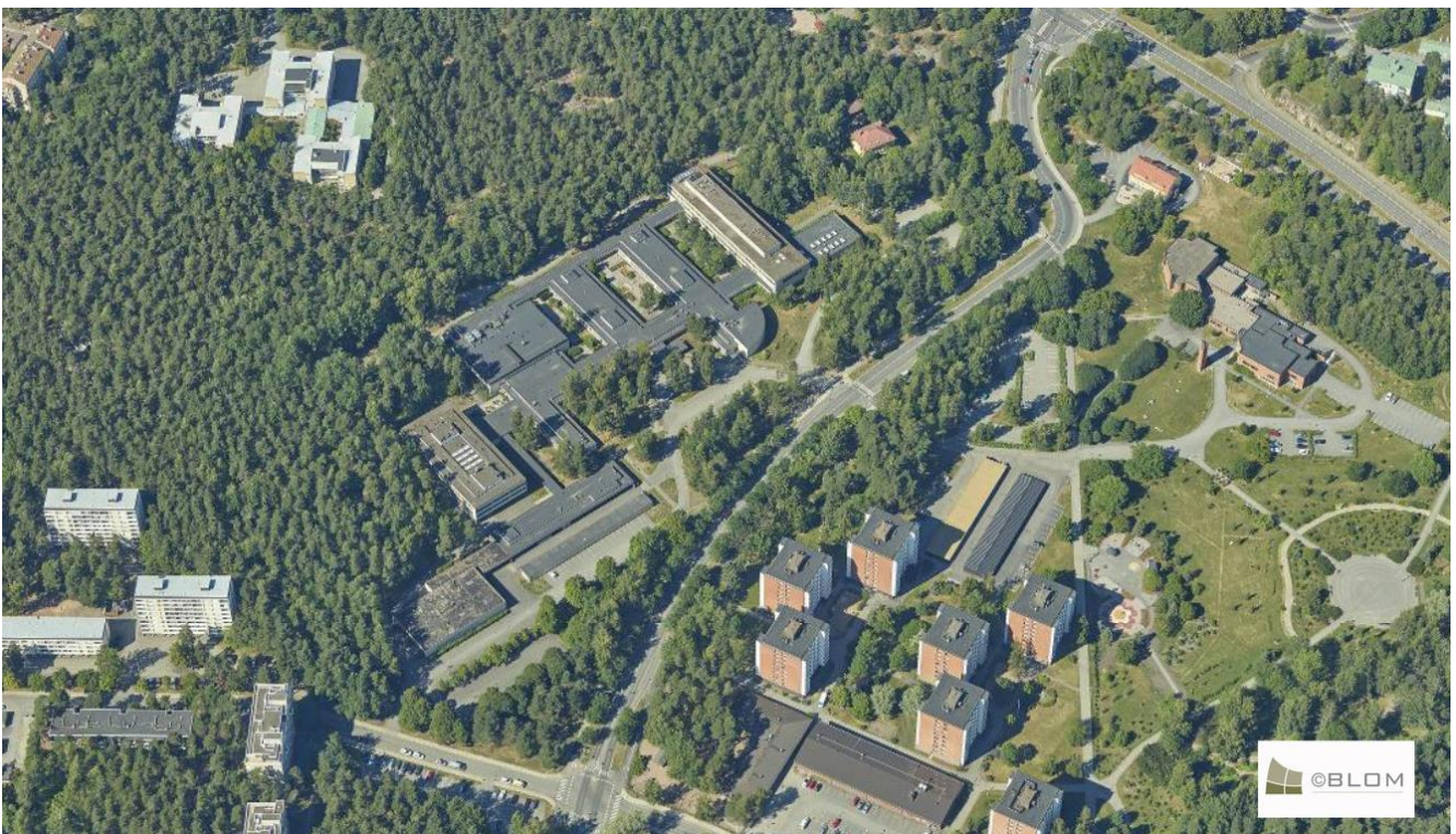
Kuva 2. Ilmakuva kaavanmuutosalueesta vuodelta 2018.