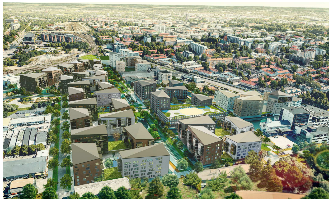
Havainnekuva Schauman Arkkitehdit Oy