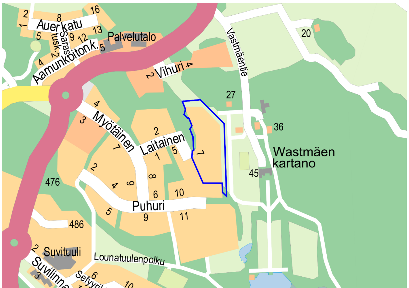
Kuva 1. Kaava-alueen sijainti opaskartalla. Suunnittelualue sinisellä rajauksella.

Kaupunginosa: Haarla Osoite: Laitainen 7, 20900 Turku