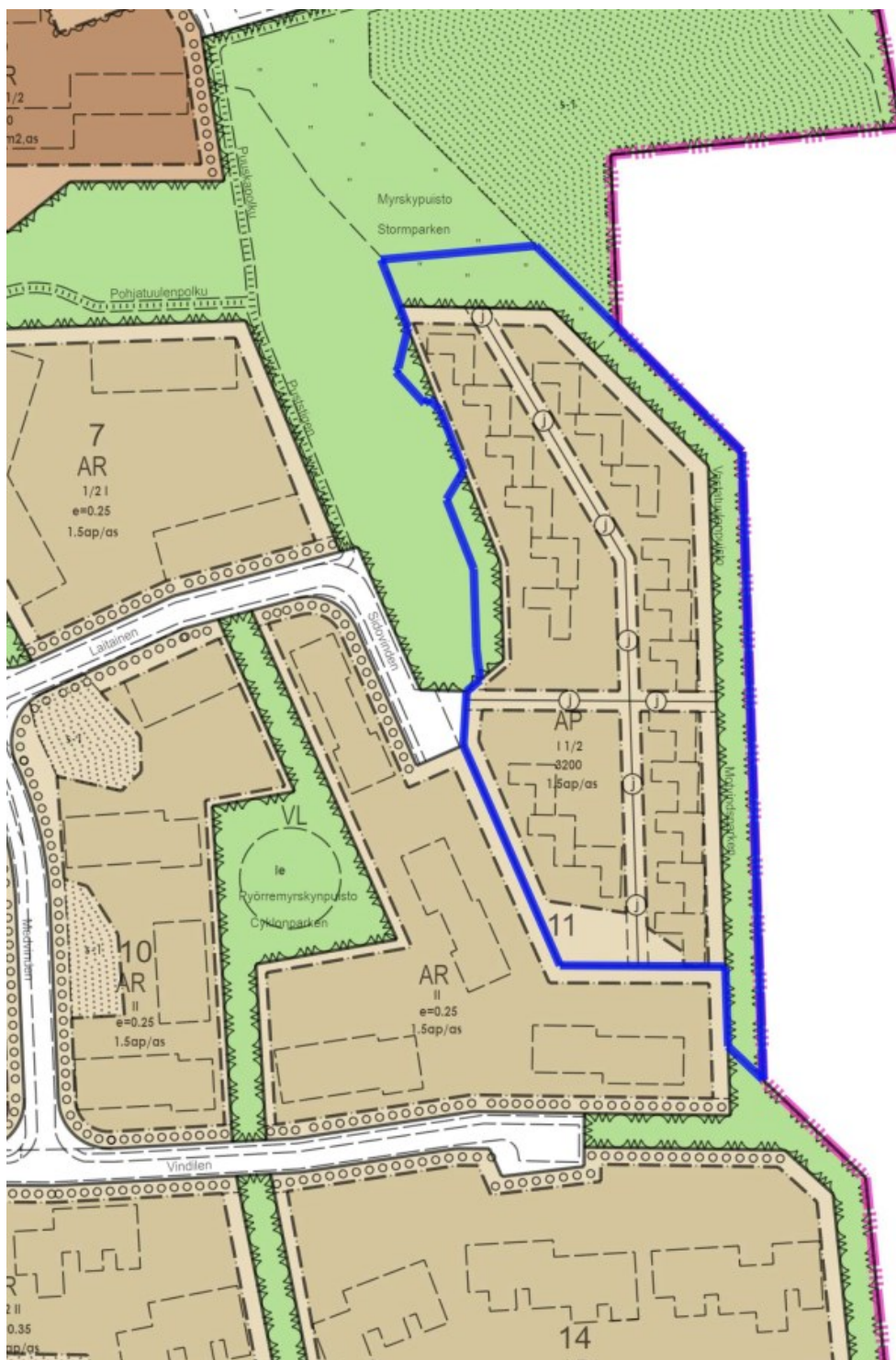
Kuva 3. Ote ajantasa-asetmakaavasta. Suunnittelualue sinisellä rajauksella.