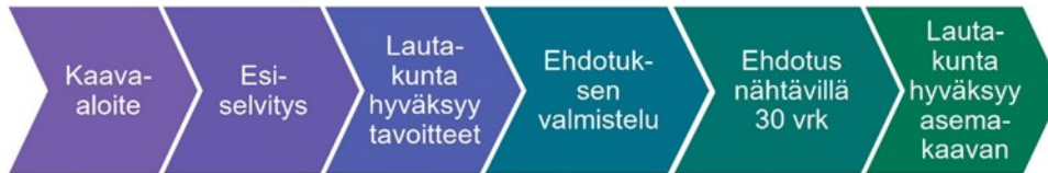
M-kokoisen kaavan prosessi

Osallisia kaavan valmistelussa ovat alueen maanomistajat ja ne, joiden asumiseen, työntekoon ja muihin oloihin kaava saattaa huomattavasti vaikuttaa, sekä viranomaiset ja yhteisöt, joiden toimialaa suunnittelussa käsitellään. Tämän hankkeen osalta osallisiksi on arvioitu seuraavat tahot: