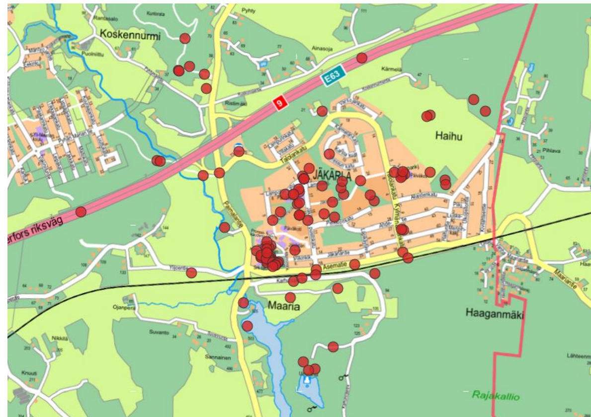
Kuvassa kyselyn pistemäisten merkintöjen kohdentuminen.