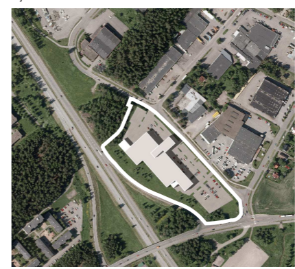
Havainnekuva Schauman Arkkitehdit Oy

POISTUVA KAAVA Merkintöjen selite: 3 m kaava-alueen rajan ulkopuolella oleva viiva, jota otsakkeessa mainittu kaavanmuutos koskee ja jolla aiemmat kaavamerkinnot ja -määräykset poistuvat. A43/2007 Aiemman, poistuvan kaavan numero ja vahvistuspäivämäärä. 16.12.2008