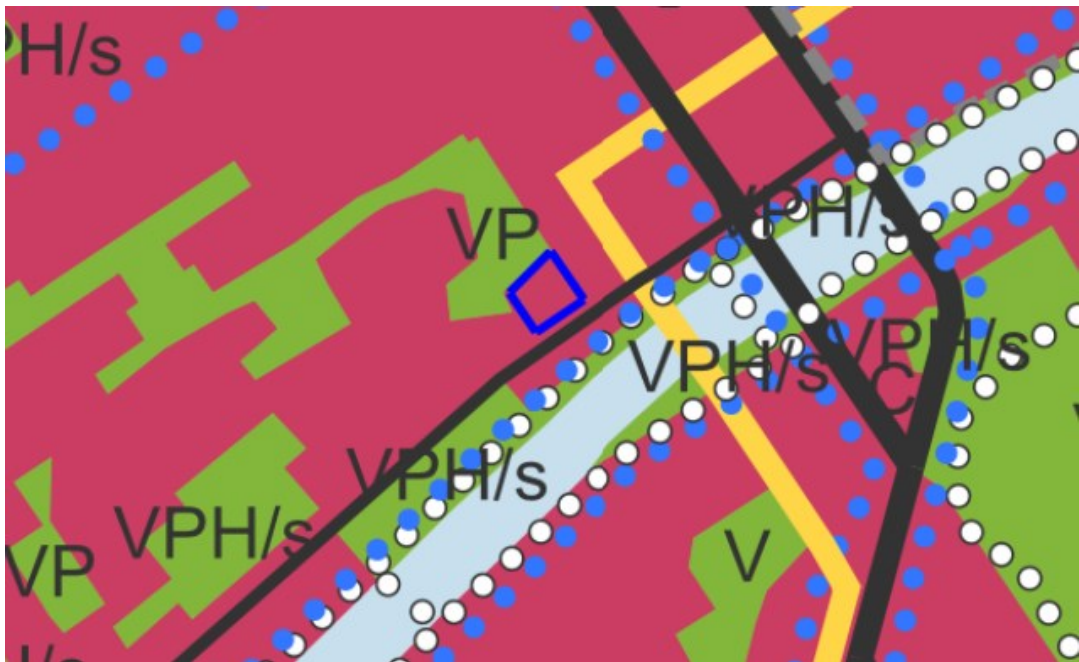
Kuva 4. Ote Yleiskaava 2029 -ehdotuksesta. Kaavanmuutosalue on rajattu sinisellä.