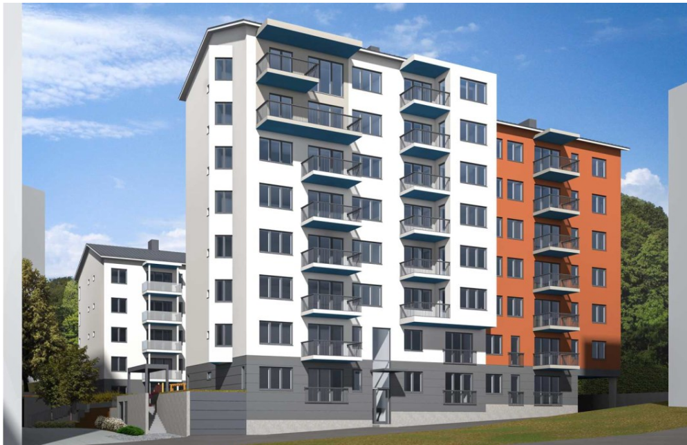
Kuva 7. Havainnekuva uudisrakentamisesta oikeustalon suunnasta nähtynä, LEMMETTI Arkkitehdit Oy.

Tontilla olevat muinaismuistot turvataan ennen rakentamista tapahtuvissa arkeologisissa kaivauksissa.