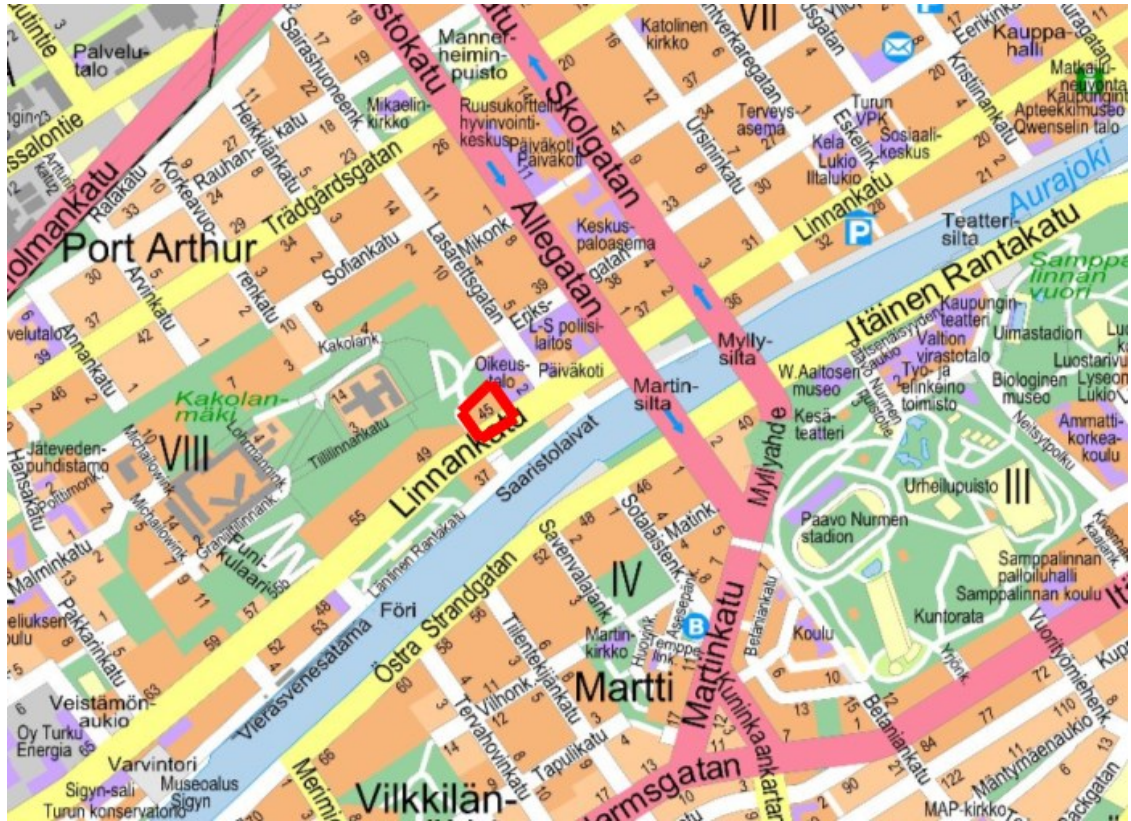
Kuva 1. Kaava-alueen sijainti opaskartalla.

Asemakaavanmuutos laaditaan Turun keskustan VIII-kaupunginosan korttelin 8 tontille 10, joka sijaitsee lähellä Aurajokirantaa Turun oikeustalon naapurissa. Laajuudeltaan noin 0,4 hehtaarin kokoisen alueen rajausta on esitetty alla olevassa karttaotteesta. Suunnittelualueita rajaavat koillisessa Turun oikeustalo, kaakossa Linnankatu ja muissa ilmansuunnissa Eerikinrinne-puistoalue.