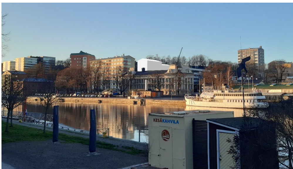
Kuva 6. Uudisrakentamisen hahmo osana jokirannan maisemaa.

Linnankadun varressa olevan 10-kerroksisen rakennuksen asema Aurajokimaisemassa tunnustetaan ja rakennus suojellaan kaavassa osana Linnankadun varren edustavien rakennusten sarjaa. Rakennuksen julkisivut tulee täten säilyttää tulevaisuudessa.