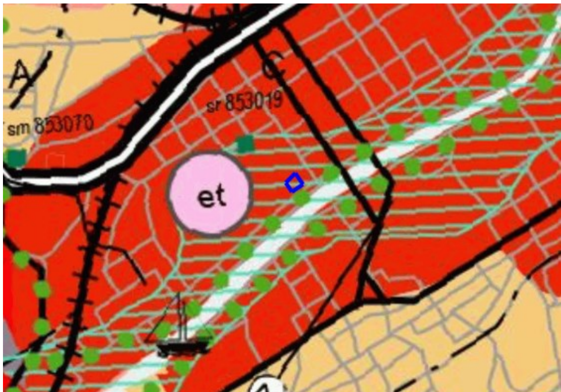
Kuva 2. Ote maakuntakaavayhdistelmästä. Kaavanmuutosalue on rajattu sinisellä.

Turun kaupunkiseudun maakuntakaavassa (vahvistettu ympäristöministeriössä 23.8.2004) ja Varsinais-Suomen taajamien, maankäytön, palveluiden ja liikenteen vaihe- maakuntakaavassa (hyväksytty maakuntavaltuustossa 11.6.2018, määrätty tulemaan voimaan 27.8.2018) kaavanmuutosalue on osoitettu kaupunkikehittämisen kohdealueeksi, keskustatoimintojen alueeksi sekä kulttuuriympäristön tai maiseman kannalta tärkeäksi alueeksi.