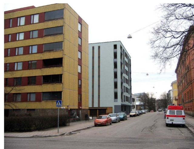
Näkymä Kaivokadulta © Arkkitehti Aho & Leno