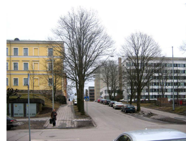
Näkymä Kurjenkaivonkentalta © Arkkitehti Aho & Leno