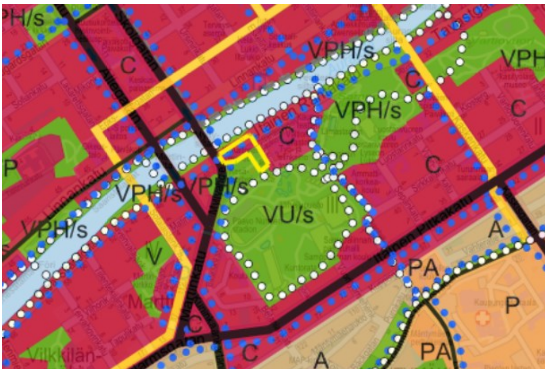
Ote yleiskaava 2029 nähtävillä olleesta ehdotuksesta (suunnittelualue keltaisella rajauksella)

Valmisteilla olevassa Yleiskaava 2029:ssä (ehdotus hyväksytty kaupunginhallituksessa 20.12.2021 § 582 ja asetettu nähtäväksi muistutusten esittämistä varten 31.1.–23.3.2022) alue varataan Turun kaupunkialuetta palveleville keskustatoiminnoille (C). Alueen pääasiallisia toimintoja ovat keskustamainen asuminen, julkiset ja yksityiset palvelut, hallinto ja keskusta soveltuvat ympäristöhäiriöitä aiheuttamattomat työpaikkatoiminnot. Alueen kaakkoisosaa kuuluu historialliseen puistoalueeseen, jolla ympäristö säilytetään (VPH/s). Alueen suunnittelussa ja käytössä tulee ottaa erityisesti huomioon alueen kulttuurihistorialliset, maisemalliset ja puutarhataiteelliset arvot sekä mahdolliset arkeologiset arvot ja luontoarvot. Lisäksi alue kuuluu Aurajokivarren arvokkaaseen maisema-alueeseen ma-2. Museon kohdalla on merkintä: Arvokas rakennus tai rakennetun ympäristön kokonaisuus Arkkitehtonisesti, kulttuurihistoriallisesti ja/tai kaupunki- tai kyläkuvallisesti arvokas rakennetun ympäristön kohde, jonka ominaispiirteet tulee säilyttää. Luvanvaraisista toimenpiteistä tulee kuulla museoviranomaista.