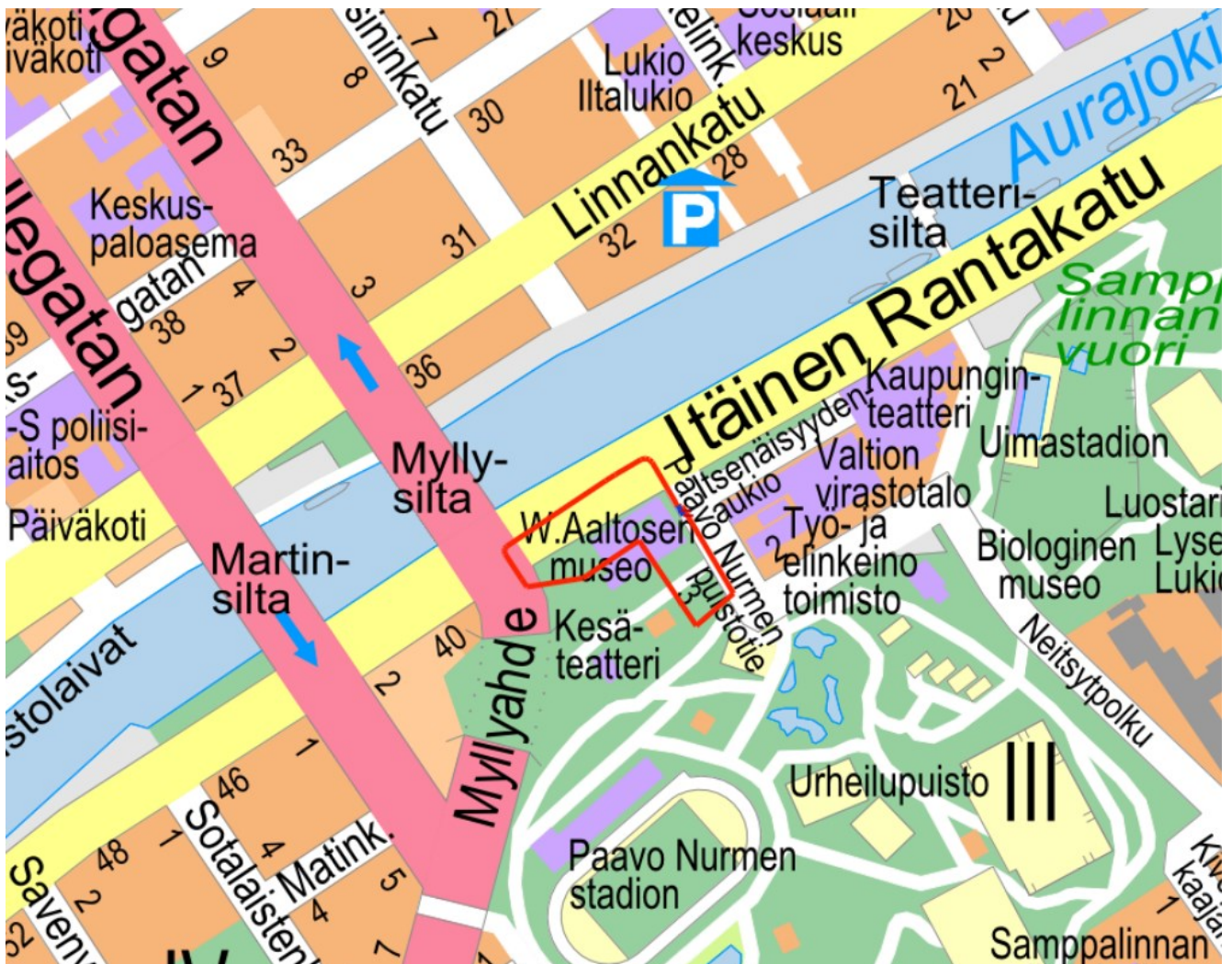
Kuva 1. Kaava-alueen sijainti. (suunnittelualue punaisella rajauksella)

Osoite: Itäinen Rantakatu 38, Paavo Nurmen puistotie 3