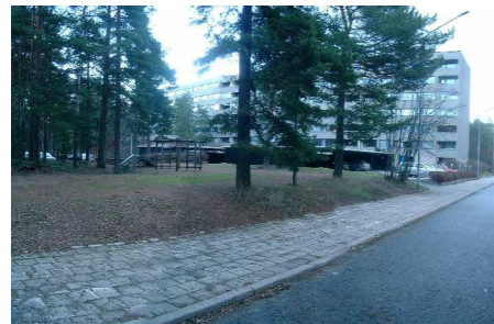
SUUNNITTELUALUE PIETARINKADUN KÄÄNTÖPAIKAN SUUNNASTA v.2007