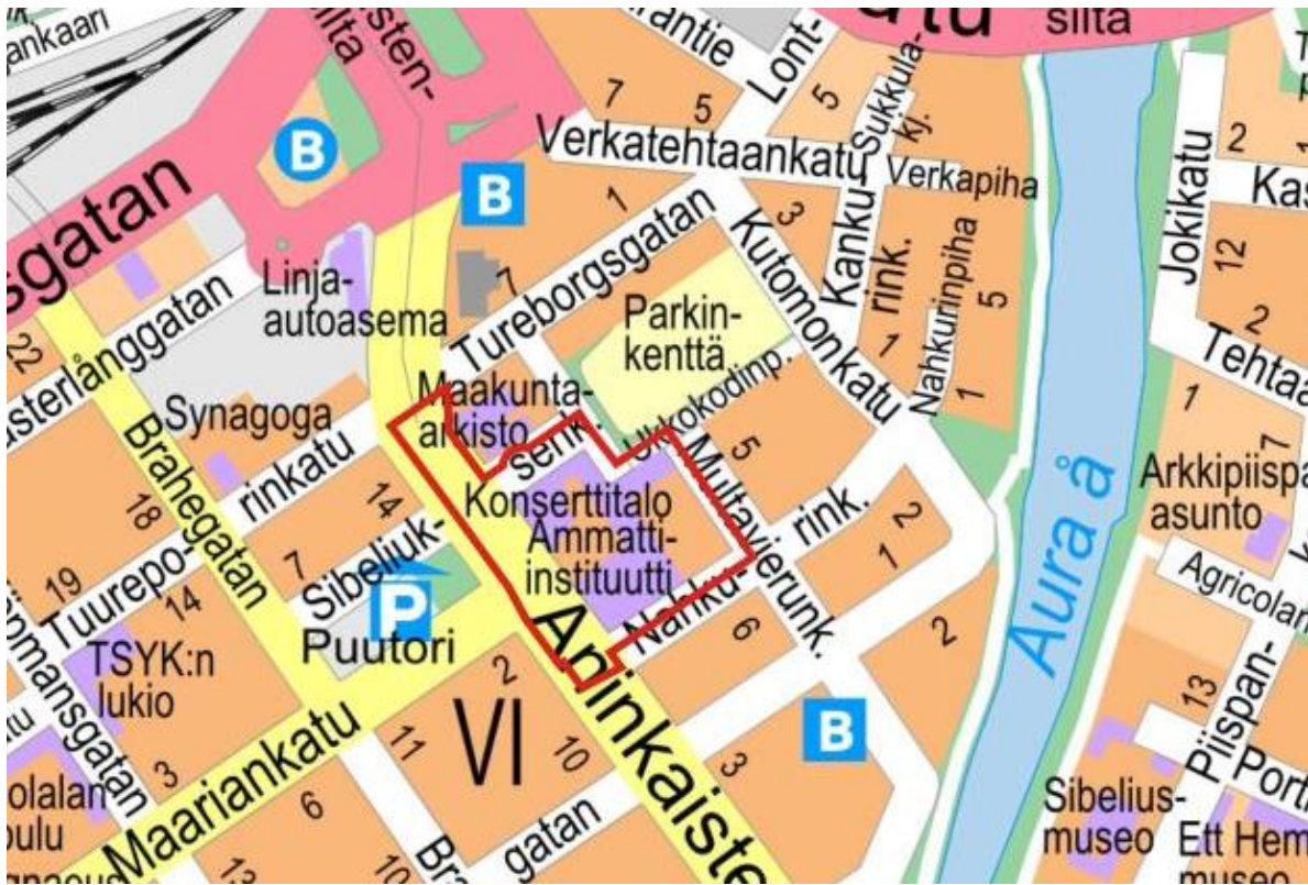
Kuva: Sijaintikarta, kaava-alue rajattu punaisella