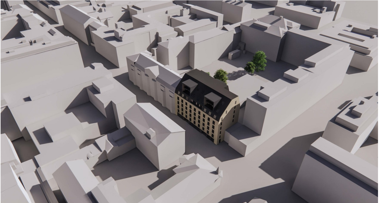
Kuva 2. Alustava tutkielma uudesta rakennuksesta.

Kaavamuutoksella on tarkoitus mahdollistaa tontilla 8 sijaitsevan vanhan rakennuksen purku ja sen korvaaminen uudisrakennuksella. Tavoitteena on asuinrakennuksen rakentaminen nykyiselle liike- ja toimistorakennusten korttelialueelle. Kaavamuutoksen yhteydessä tutkitaan, onko kerrosluvun korottaminen sekä rakennusoikeuden maltillinen lisäys mahdollista. Kaupunkikuvallisista ja toiminnallisista syistä Yliopistonkadun puolelle katutasoon tulee osoittaa liiketiloja. Kaavoituksen yhteydessä tulee kiinnittää erityistä huomiota rakennuksen liittymiseen viereisiin rakennuksiin, miellyttävän ulko-oleskelualueen mahdollistamiseen, pihan vehreyden lisäämiseen sekä pihatoimintojen liittymiseen tonttiin 9. Tontti 9 otetaan kaavamuutokseen mukaan, jotta esimerkiksi pysäköintiin ja ajoyhteyksiin liittyvät yhteisjärjestelyt voidaan suunnitella toimiviksi. Sisäpihalla oleva pysäköintirakennus on korttelin yhteiskäytössä ja siihen ei ole tarkoitus tehdä tässä kaavamuutoksessa muutoksia.