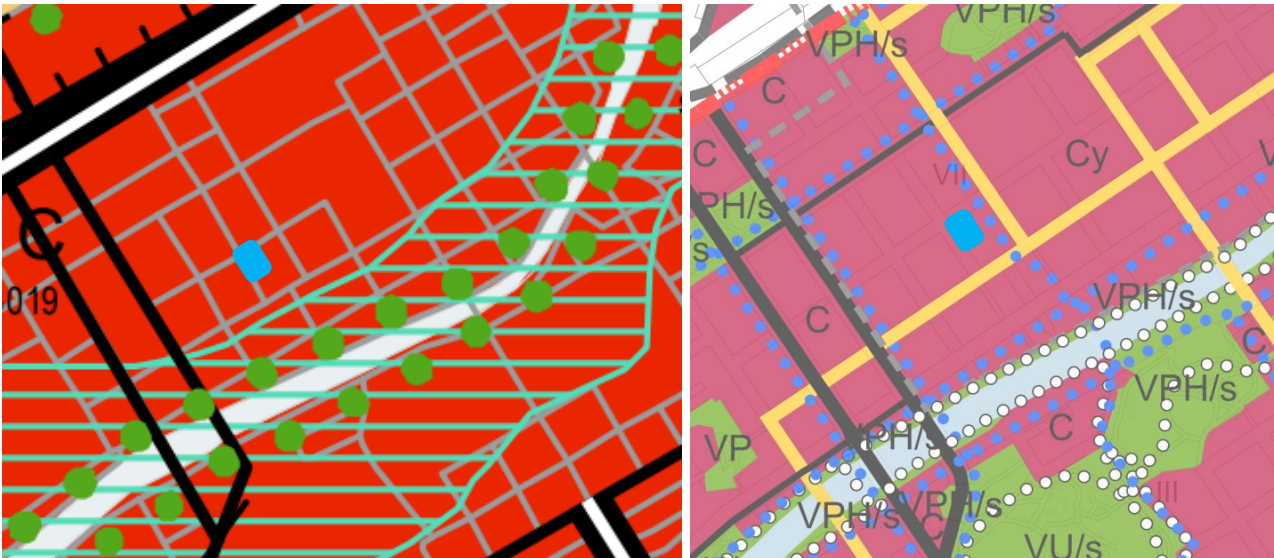
Kuvat 3. ja 4. Vasemmanpuoleisessa kuvassa on ote Turun kaupunkiseudun maakuntakaavasta. Oikean puoleisessa kuvassa on ote Turun yleiskaavan 2029 ehdotuksesta. Kaava-alueen sijainti merkattu likimääräisesti sinisellä suorakulmiolla.

Turun yleiskaavassa 2020 alue on pääkeskustasoisten keskustatoimintojen aluetta (C) .